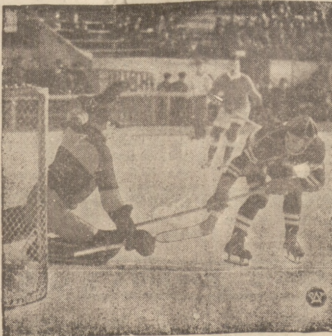
Na zdjęciu z lewej efektowny moment pod bramką Huculów na meczu o mistrzostwo świata w hokeju z Polską. Na zdjęciu z prawej — jeden z patroli biorących udział w marszu Huculskim Szlakiem II Brygady Legionów Polskich na mecie w Worochcie. W klasyfikacji ogólnej wygrał Z. S. Zakopane.

poleca swoje usługi. Specjalna organizacja do barwienia i bielienia najmniejszych partii przedzdy wełnianej, bawełnianej, lnu, jedwabnej etc. Barwienie sztuk i luźnego materiału. Prosimy żądać cenników. Adres — Włóczki - Wełny „Trójkąt w Kole” S. A. Bielsko, dk. p. 240