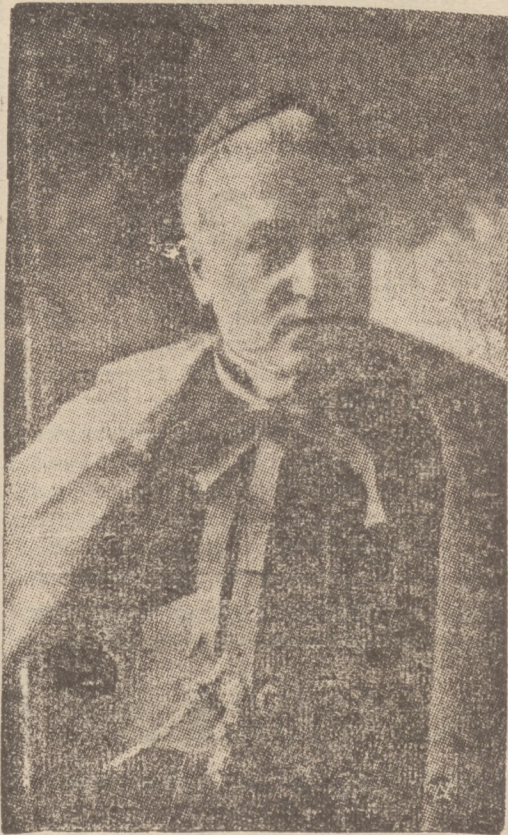
KARDYNAŁ AUGUST HLOND bierze udział w odbywającym się w Rzymie konklawe.

Z rana o godz. 9 kardynałowie wysłuchali Mszy św., odprawionej w kaplicy papińskiej przez dziekana świętego kolegium kardynalskiego, Granito Pignatelli di Belmonte. O godz. 15 kardynałowie zgromadzili się w tejże kaplicy syktyńskiej gdzie dokonali uroczystego wejścia do konklawe.