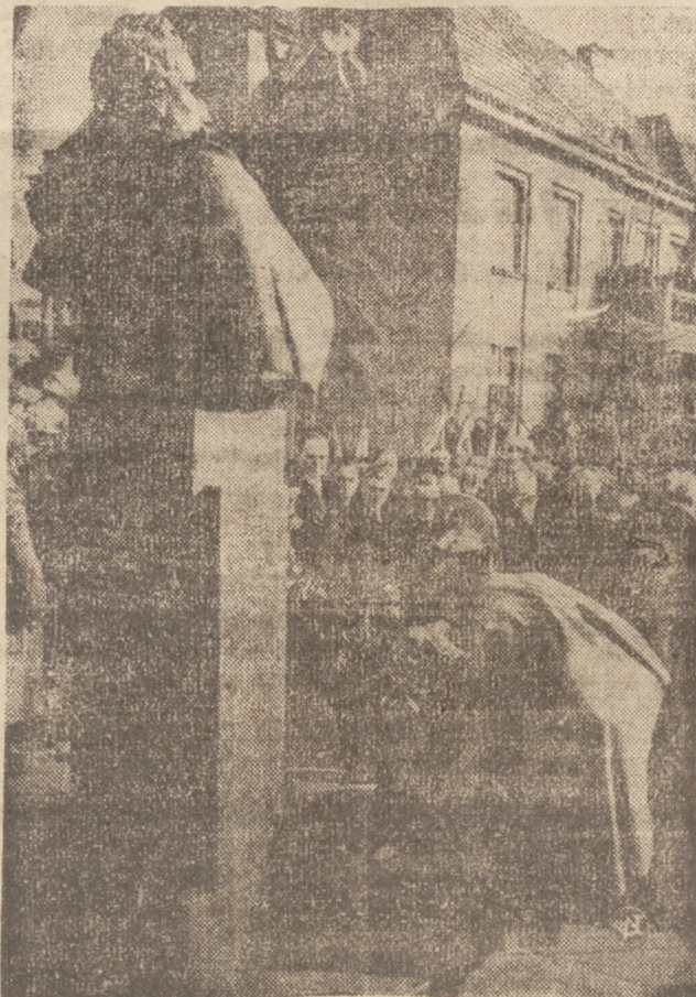
Na zdjęciu — włoski min. spr. zagr. min. hr. Ciampi — składa wieniec u stóp odsoniętego bohatera Włoch i Polski płk. Francesco Guilo.

Za ten hojny dar wojewódzki komitet pomocy dzieciom i młodzieży tą drogą składa w imieniu rzeszy biednych dzieci kieleckich staropolskie „Bóg zapłać”.