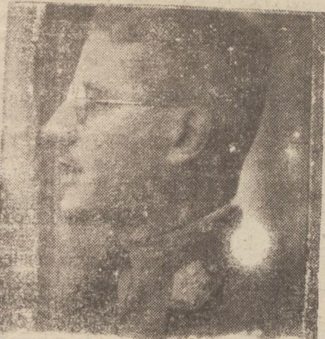
Kurt Schuschnigg, b. kanclerz Austrii.