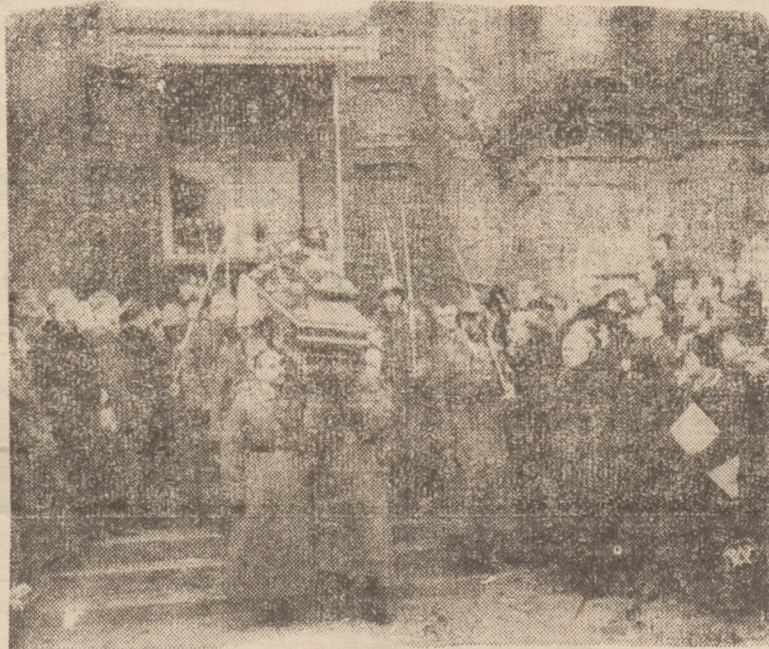
POGRZEB S. P. PLK. PUSZCZYŃSKIEGO.

Sąd wymierzył mu trzy miesiące aresztu i 300 złotych grzywny z zamianą w razie niezapłacenia na miesiąc aresztu. Zasadnicza kara pozbawienia wolności została skazaniu kupcowi zawieszona na okres dwuletni