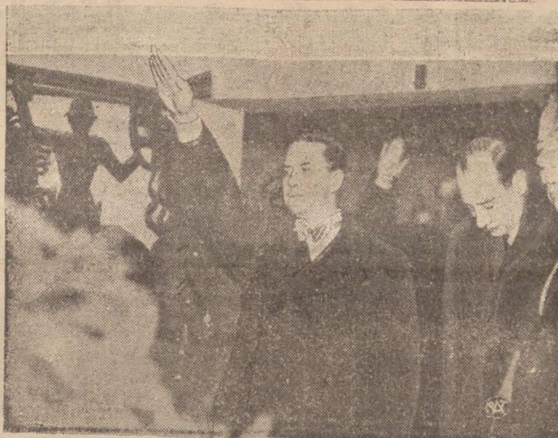
PO WIZYTCIE MINISTRA CIANO W POLSCE

Idea kolonialna stanowi wartość twórczą, która winna być rozwijana na każdym odcinku życia społecznego.