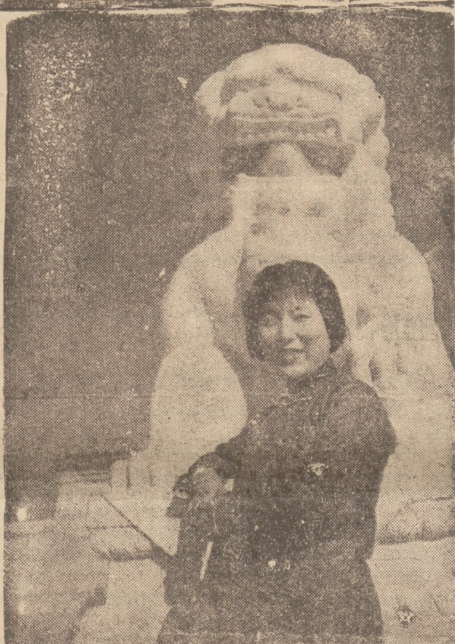
Na tle archaicznej dawnej sztuki chińskiej — widzimy nowoczesną

Placówka gospodarcza Targów Katowickich, które w roku bież. po raz jedenasty o tworzą swe podwoje, dojrzała się do sprawy propagandy polskiej wytwórczości. To też przedsiębiorstwa przemysłowe, wytwórcze i przetwórcze, którym zależy na powiększeniu zbytu swoich wyrobów na Śląsku powinny w dobrze pojętym interesie własnym, wykorzystać nadarżającą się okazję do zainteresowania się tym rynkiem zbytu przez udział w XI-tych Targach Katowickich.