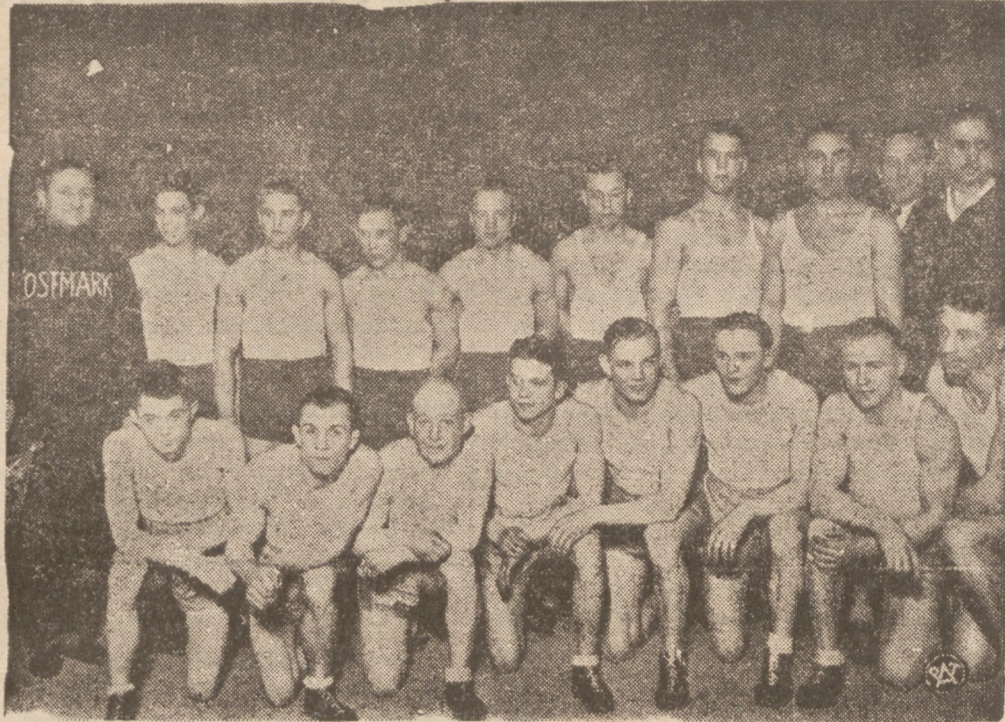
NA RINGU BOKSERSKIM

W dniu 7 marca odbył się w Katowicach mecz bokserski między reprezentacją Śląską i Wiednia, zakończony zwycięstwem drużyny Śląskiej w stosunku 1:5. Na zdjęciu — obie drużyny. Reprezen-