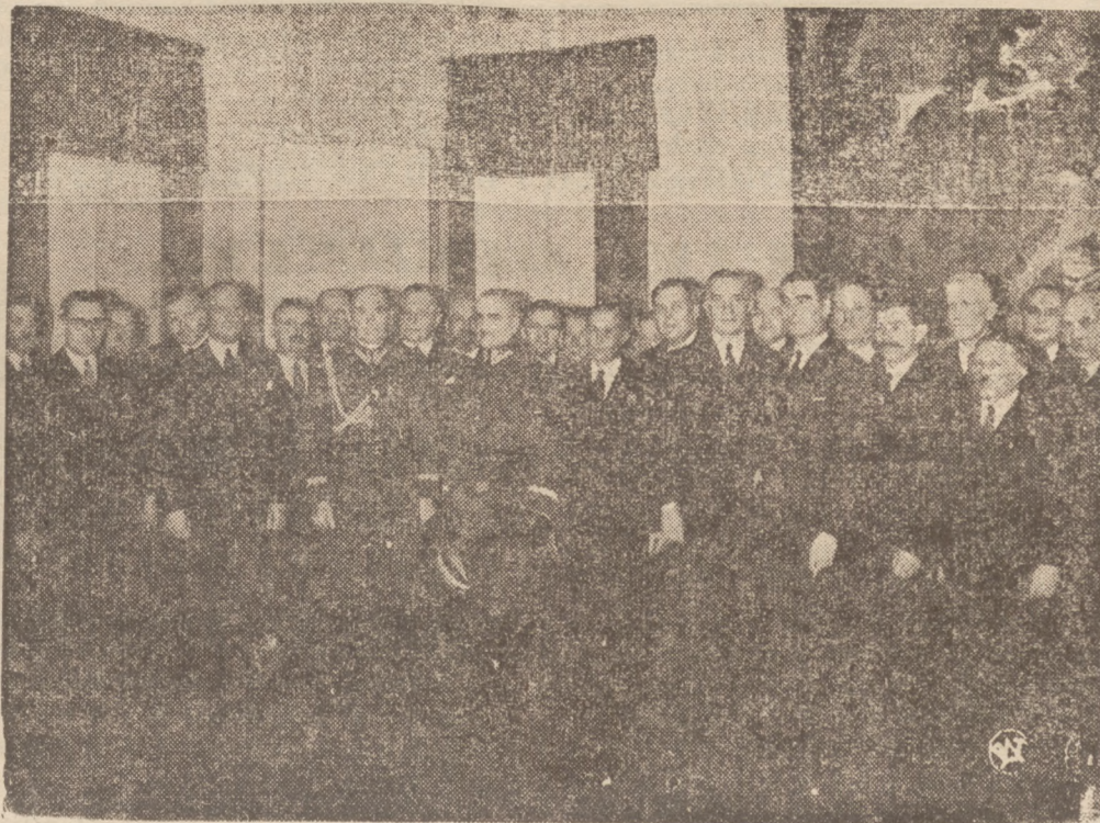
ZŁOŻENIE HOLDU MARSZAŁKOWI ŚMIG LEMU-RYDZOWI PRZEZ MIASTA I GMINY

Z Husztu donoszą, że premier Wołoszyn wysłał do prezydenta Hachy, premiera Berana i ministra spraw zagr. Chvalkovskiego telegraficzny protest przeciw mianowaniu gen. Prehala ministrem spraw wewnętrznych na Rusi Zakarpackiej. Również zarząd karpatoruskiej narodowej partii zjednoczonej wysłał do Pragi podobny protest.