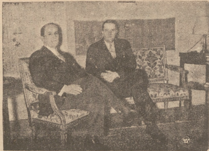
ANGIELSKI MINISTER HUDSON W WARSZAWIE.

W dniu 19 bm. przybył do Warszawy na czele delegacji handlowej podsekretarz stanu w brytyjskim ministerstwie Handlu Zagranicznego R. S. Hudson, celem odbycia szeregu konferencji i narad