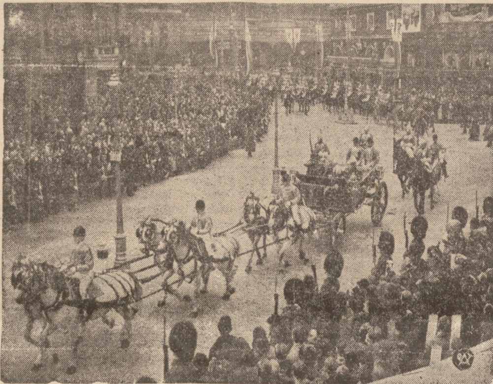
WIZYTA PREZYDENTA FRANCJI W LONDYNIE.

własnych domków, a potrzebują przy tym dostępnego kredytu gotówkowego, mogą każdego dnia w godzinach urzędowych zgłaszać się do Wydziału Technicznego zarządu miejskiego przy ul. Piłsudskiego, gdzie otrzymają szczegółowe i wyczerpujące informacje.