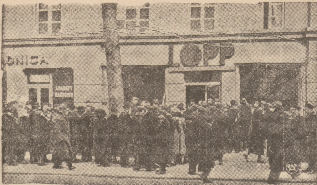
WIELKIE ĆWICZENIA O. P. L. W WARSZAWIE.

Onegdaj zostały zarządzane w Warszawie wielkie ćwiczenia obrony przeciwlotniczej.