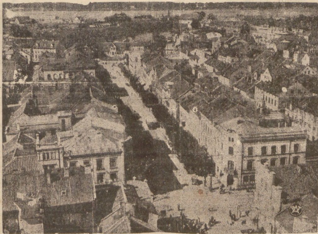
Na zdjęciu rzut oka na Kłajpedę. Na dalszym planie fragment z portu.