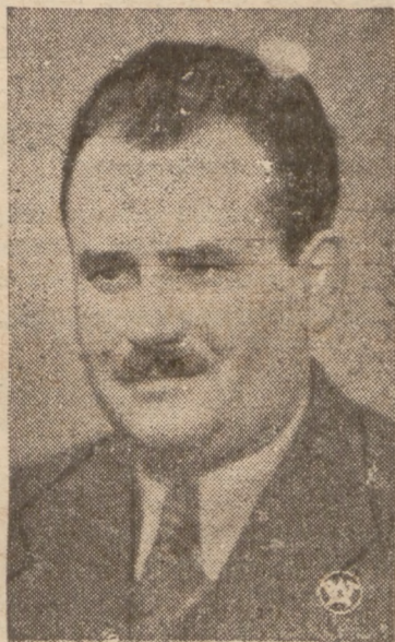
PIERWSZY PRZEDSTAWICIEL DYPL. MATYCZNY SŁOWACJI W POLSCE.