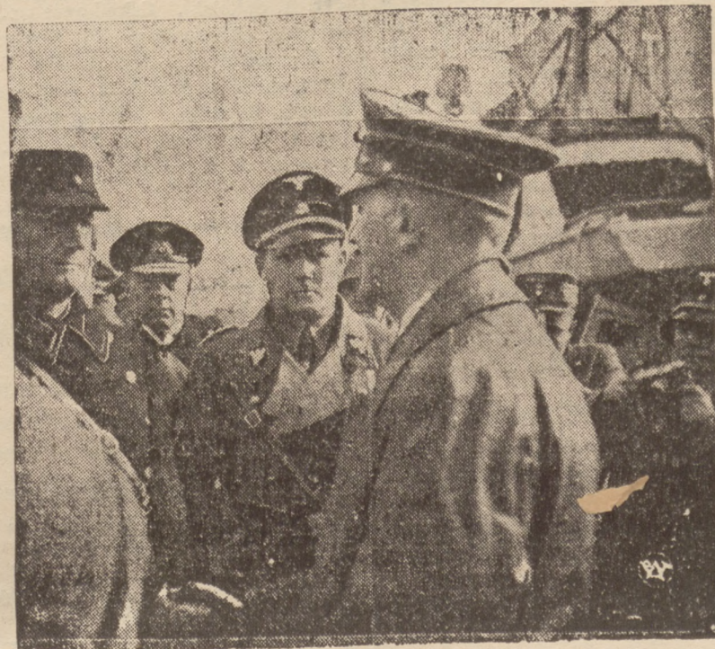
KANCLERZ HITLER W KŁAJPEDZIE.

Do Kłajpedy przybyła, składająca się z 6-ciu jednostek flotyła łodzi podwodnych Weddigen wraz z okrętem macierzystym „Donau”.