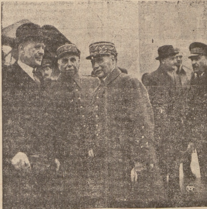
SZEF SZTABU GENERALNEGO W. BRYTANII WE FRANCJI

Polecamy również lód sztuczny z wody źródlanej.