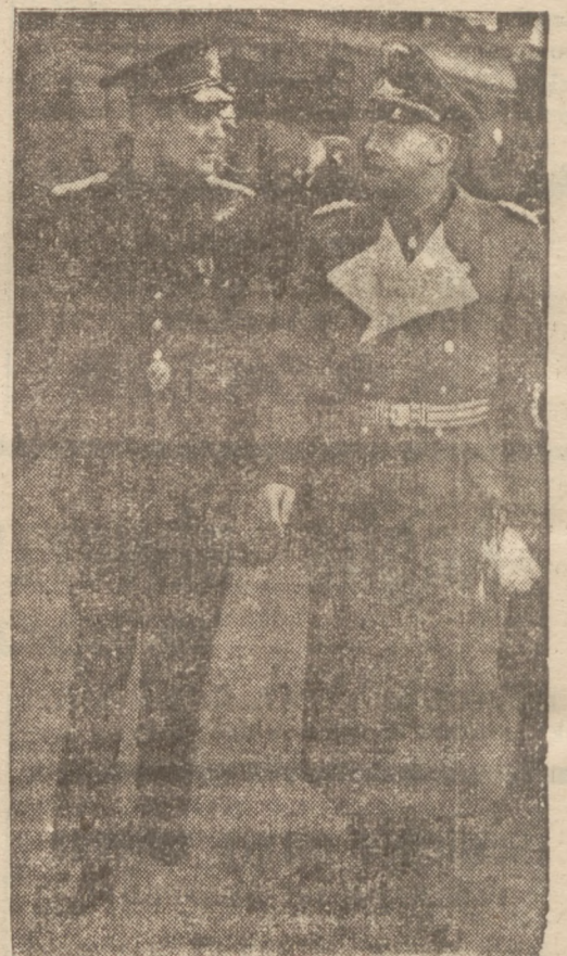
MINISTER GAFENCU W BERLINIE.