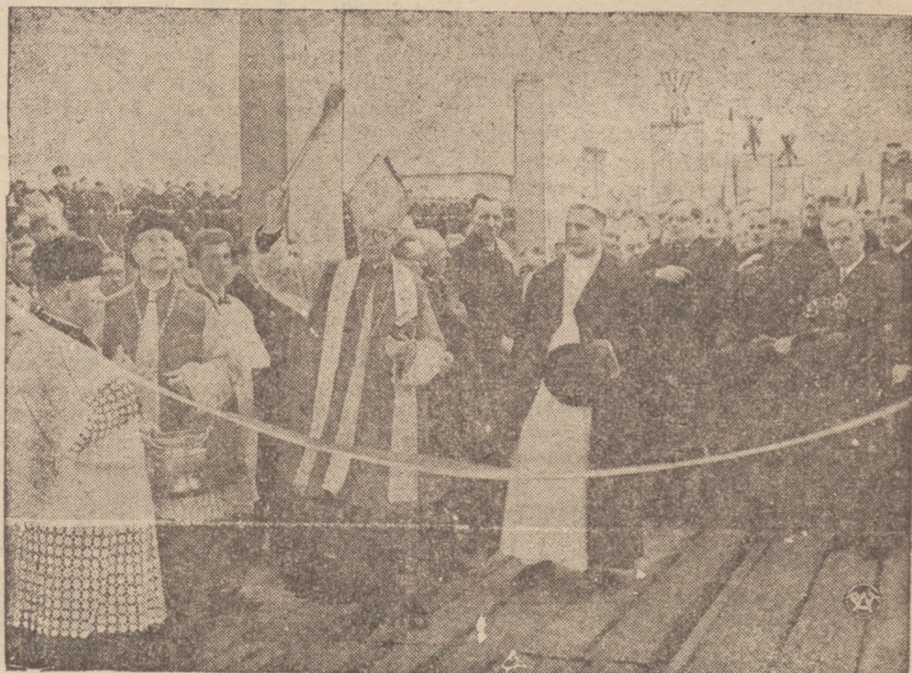
UROCZYSTE POŚWIĘCENIE ODCINKA MAGISTRALI KOLEJOWEJ ŚLĄSK — BAŁTYK.