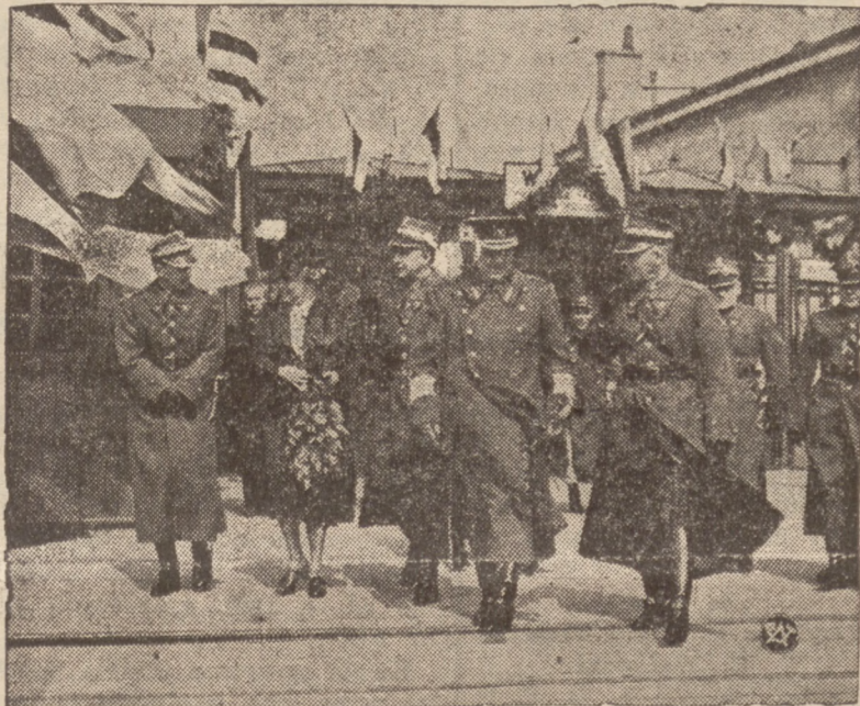
ODJAZD GEN. LAIDONERA.

Onegdaj w godzinach przedpołudniowych opuścił Warszawę, udając się do Tallina, naczelny wódz armii estońskiej gen. Laidoner, który w ciągu kilku ostatnich dni bawił w Polsce, jako gość P. Marszałka Śmigłego - Rydza.