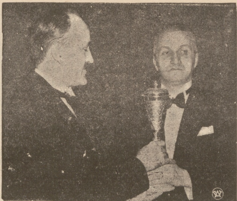
POLSKA MISTRZEM BOKSERSKIM EUROPY.

Drużyna polska w czasie rozgrywek w Dublinie zdobyła bokserskie mistrzostwo Europy, uzyskując również najlepsze wyniki indywidualne.