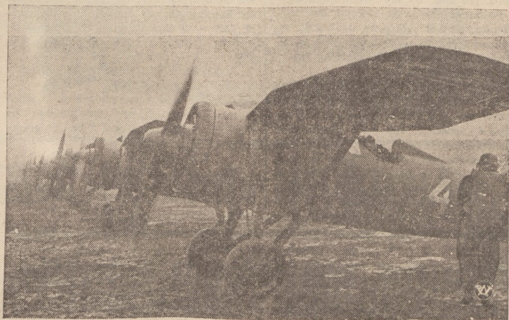
POTĘGA LOTNICZA POLSKI.

Pożyczka Obrony Przeciwlotniczej jest przeznaczona na stworzenie polskiej po- tęgi lotniczej i uzupełnienie artylerii