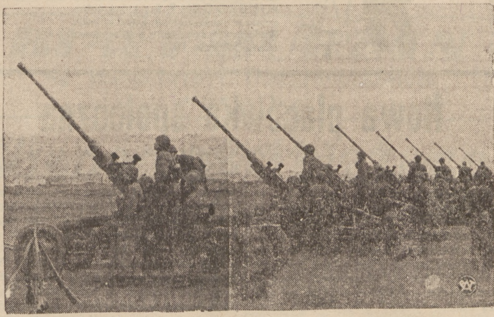
Polska bateria artylerii przeciwlotniczej gotowa do wystrzału.

Donoszą z Damaszku, że w kołach politycznych i w opinii publicznej wzrasta się ostatnio prąd, domagający się ogłoszenia Syrii królestwem, które obejmie nie tylko właściwą Syrię, — lecz i Liban, Dżebel i Druz i ziemię Hiauitów, Francuskie władze mają sprzyjać idei królestwa, gdyż dotychczasowy ustroj nie potrafił doprowadzić do pogodzenia interesów francuskich z syryjskimi.