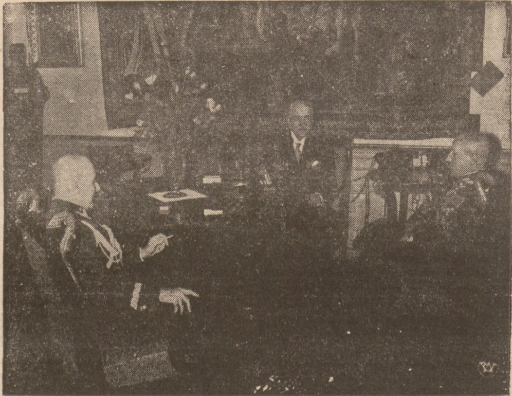
Na zdjęciu moment z audycją gen. Rasztikisa w towarzystwie Marsz. Śmigłego Rydza u Pana Prezydenta R. P. na Zamku Królewskim w Warszawie.