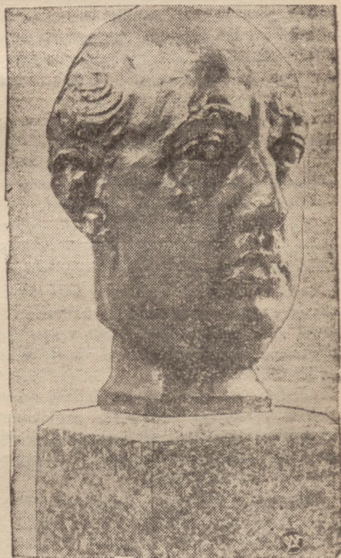
RZEZBA GŁOWY GEN. FRANCO.