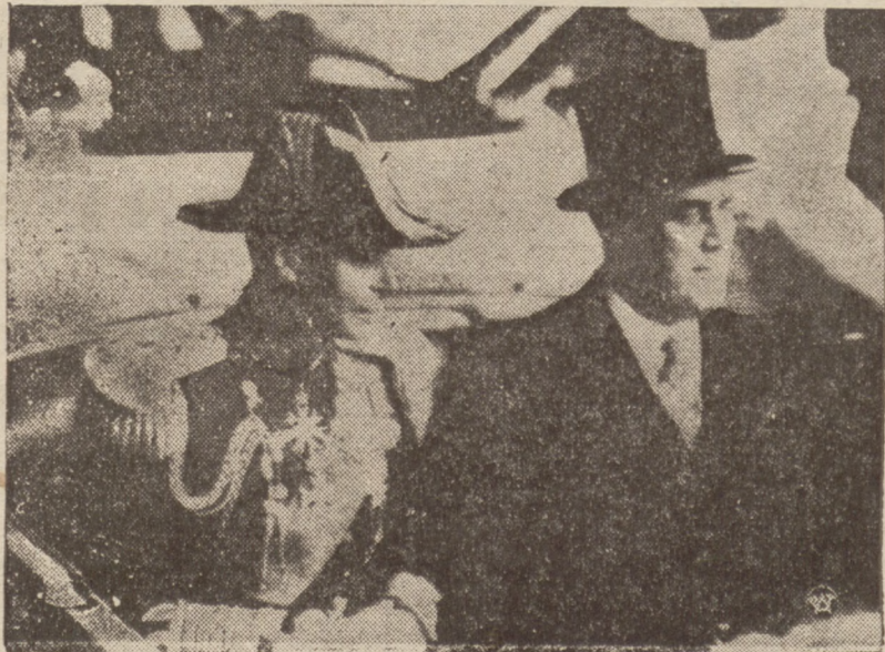
KRÓL I KRÓLOWA W. BRYTANII W WASZYNGTONIE