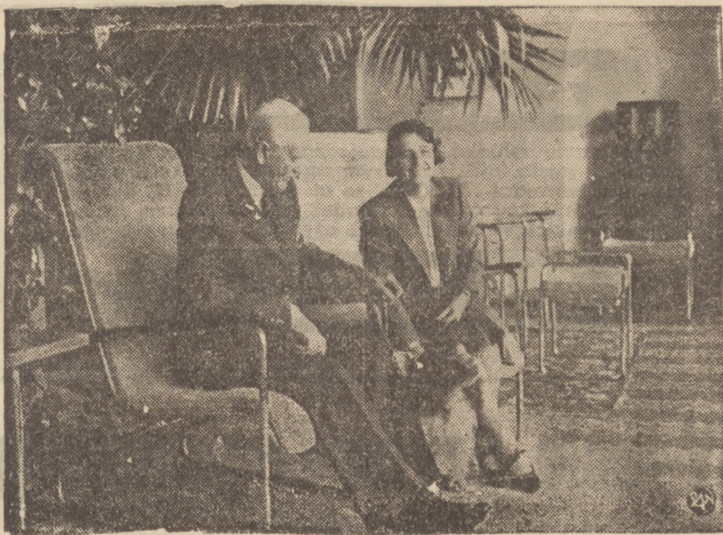
Z WYWCZASÓW PANA PREZYDENTA RZECZYPOSPOLITEJ

Zasoby materialne polskich kadr wojskowych, wyruszających w bój o niepodległość — nie stały w najmniejszym stosunku do bogactwa i siły ujarzmionego 25 milionowego narodu polskiego.