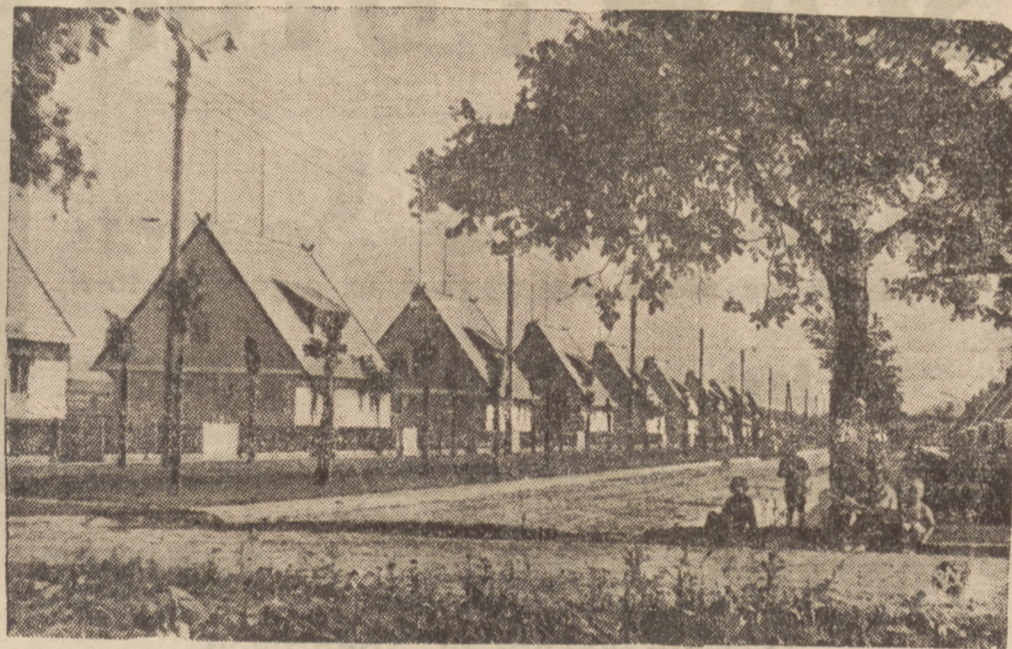
NOWE OSIEDLE DLA KOLEJARZY W RUMII.

Na zdjęciu jeden z najstarszych wiekiem uczestników Złotu Sokolstwa dzielnicy Mazowieckiej, który to zlot odbył się w Wilnie w tych dniach gromadząc ponad 2 tys. sokolików, niesie poduszkę z votum - ryngrafem. Ryngraf ten został przez sokolów podczas trwania złotu zawieszony przed Cudownym Obrazem Matki Boskiej Ostrobramskiej w Ostrej Bramie