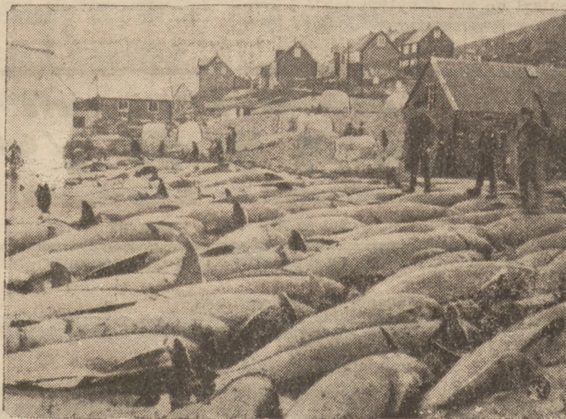
WIELKI POŁÓW DELFINÓW W PÓLNOCNEJ NORWEGII