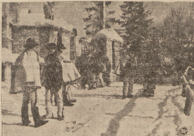
PRZED „TYGODNIEM GÓR” w ZAKOPANEM.

„Exchange Telegraph” dowiaduje się, że sekretariat Ligi Narodów i międzynarodowe biuro prasy przeniesione zostaną na wypadek wojny z Genewy do Vichy.