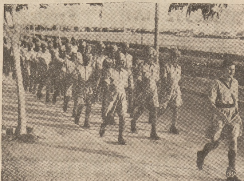
ANGLIA ZWIĘKSZA SWOJE GARNIZONY NA GRANICY LIBII.

Początkowo zatrudniał 30 ludzi, obecnie 35 tysięcy. Zakłady zajmują się specjalnie produkcją granatów armat, czołgów karabinów maszynowych i samolotów. Istnieje specjalny pa wilon przechowujący każdy typ broni wypuszczonej przez te zakłady.