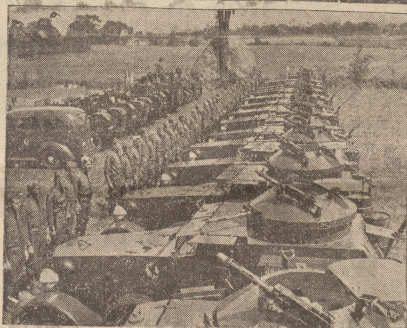
AMERYKA W POGOTOWIU BOJOWYM.

Tak tedy W. Brytania po staremu króluje na falach i chyba nie tak szybko jej przewaga będzie zachwiana.