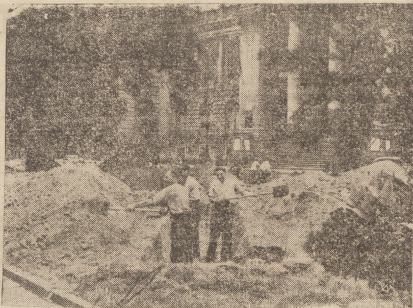
ZARZĄDZENIA OCHRONNE STOLICY

w Sosnowcu, ul. 3-go Maja 20. Tel. 616-60