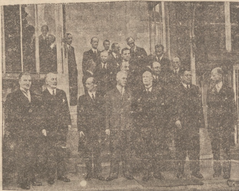
ZAKOŃCZENIE KONFERENCJI PAŃSTW BLOKU OSŁO W BRUKSELI.

Do cyfr powyższych dodać należy 20 kompanij saperów, 12 kompanij artylerii. Obecnie nie ulega żadnej wątpliwości, że położenie Japonii jest bardzo trudne.