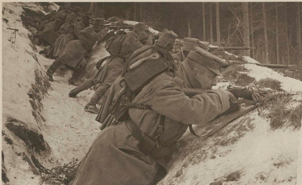
W rowie strzeleckim