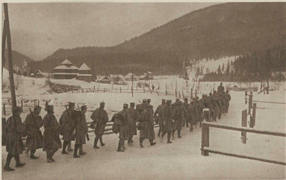
Rezerwa w drodze na front