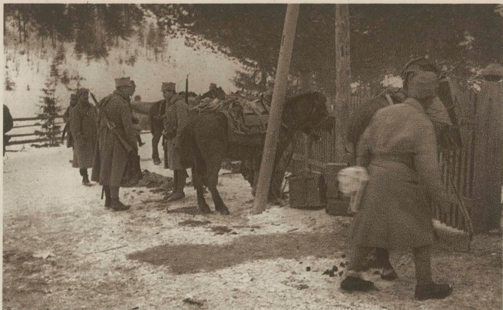
Karabiny maszynowe w rezerwie

tet lae, rot, au s les usi ora ire llis mak sha! in weu ad, lych, K stow, no s ni aw.