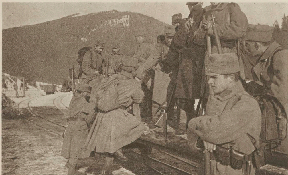
Kolejka do Zielonej