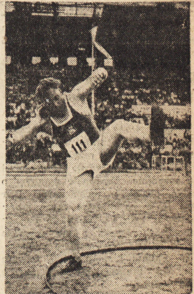
PRYW CZ — (ŁKS) wygrał pchnięcie kulą, uzyskując wynik 13,46.

W ogólnej punktacji zwyciężyła „Gedania” Gdańsk.