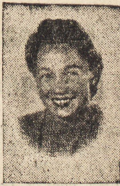
Mitan (Legia - Kraków) wygrała w skoku w zwyz, uzyskując również dobrą wyniki w skoku w dal i w biegu na 60 m. przez płot.

800 m pań: 1. Świdzki („Wisła” Kraków) 2.10. 2. Świniarski (Gdańsk) 2.11,3, 3. Staniszewski („Syrena” — Warszawa) 2.12.1. Skok wzwyż: 1. Zwoliński („Syrena” — Warszawa) 1.70, 2. Rytysz (ŁKS) 1.70, 3. Dąbrowski (Gdańsk) 1.70. 3.000 m: 1. Boniemski (Gdańsk) 9.37. 2. Dzwonkowski („Zryw” — Włocławek) 9.40, 3. Kielas (Gdańsk) 9.54. Skok w dal: 1. Adamczyk („Odra” — Wrocław) 6.61. 2. Pawłowski (DKS Łódź) 6.28, 3. Kuźmicki (DKS — Łódź) 6.19. Trójskok: 1. Kuźmicki (DKS — Łódź) 12,60, 2. Pawłowski (DKS — Łódź) 12,21, 3. Kuczyński (ŁKS) 11,65. Sztafeta wahadłowa 4x50 pań: 1. Grudziądzki KS w składzie: Gawrońska, Gburkówna, Felska — 31,8 sek., 2. „Legia” — Kraków 32,1, 3. „Gedania” Gdańsk 33,9. Sztafeta wahadłowa 4x50 pań: 1. „Gedania” Gdańsk