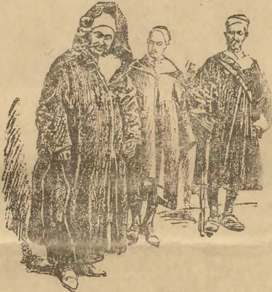
ABD-EL-KRIM, ORGANIZATOR I WÓDZ POWSTANIA W MAROKKO, WEDŁUG OSTATNIEGO ZDJĘCIA.

CZŁOWIEK, KTÓRY PODJĄŁ WOJNĘ PRZECIW DWU PAŃSTWOM.