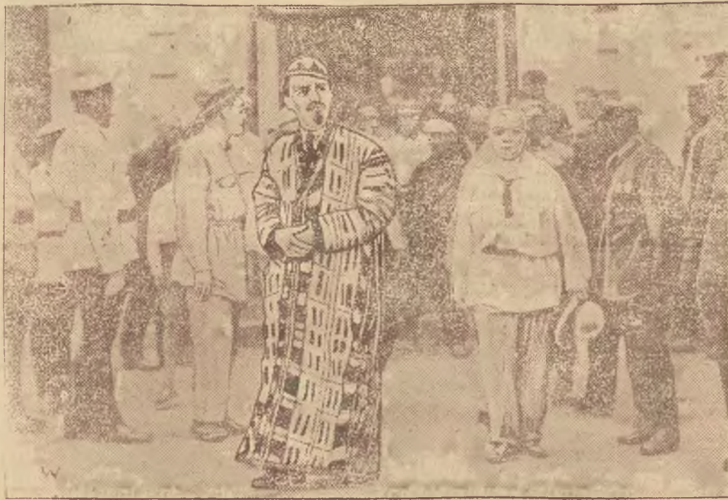
Przedstawiciel kupiectwa z Turkestanu w stroju narodowym.

znalezienia odbiorców dla swoich towarów. Bogate stroje narodowe tych kupców tworzą wspaniałą symfonię barw, która niezwykle ożywia ogólny obraz targów.