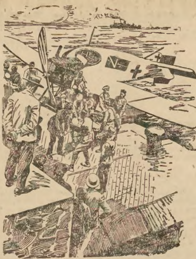
Z pola walki w Marokku Hiszpanie transportują rannych samolotami. — Ilustracja nasza przedstawia wyładowanie rannych w Hiszpanii.