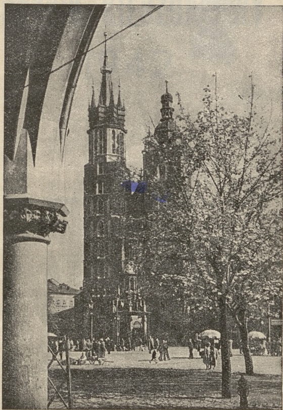
Kościół Marjacki w Krakowie