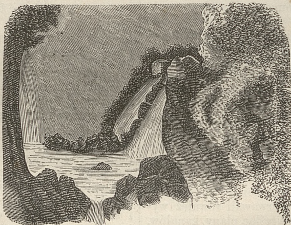
Fig 5. Tivoli.

Przekonywamy się z przeglądu rozpraw w przedmiocie wychowania, że jak z jednej strony uwzględniano korzyści spływać mogące z podróżowania młodzieży po zagranicznych krajach, tak z drugiej strony upatrywano niebezpieczeństwo w pochopności do naśladowania zbytków oraz innych szkodliwych zwyczajów. W świetnej tak zwanej Zygmuntońskiej epoce naszego piśmiennictwa, traktaty lub rozprawy o stosunkach domowych, o małżeństwie i wychowaniu, w szeregu różnych żywotnych kwestyj niepoślednio zajmują miejsce. Pomiędzy wiersze satyrycznej treści, gdzie znajdujemy wszystkie grzechy powszednie, odmalowane w nader rubasznej formie, lecz zastanowimy się nad utworami, gdzie kwestya małżeństwa i wychowania z poważniejszej przedstawia się