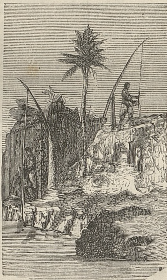
Fig. 4. Irrygacja w starożytnym Egipcie (str. 19).

babiloński był jednym słowem olbrzymim lasem o dwudziestu piętrach. Galerie obejmowały królewskie apartamenty przeróżnie ozdobione, z których jeden pokój ze sklepieniem zaopatrzonym otworami, mieścił w sobie maszyny czerpiące ogromną ilość wody z Eufratu, chociaż nikt z zewnątrz nie mógł dopatrzeć pracy jaką one spełniały. W ten sposób mnóstwo tajemniczych kanałów krążyło wśród roślin, roznosząc wilgoć a tem samem utrzymując świeżość krzewów w ogrodach wiszących.