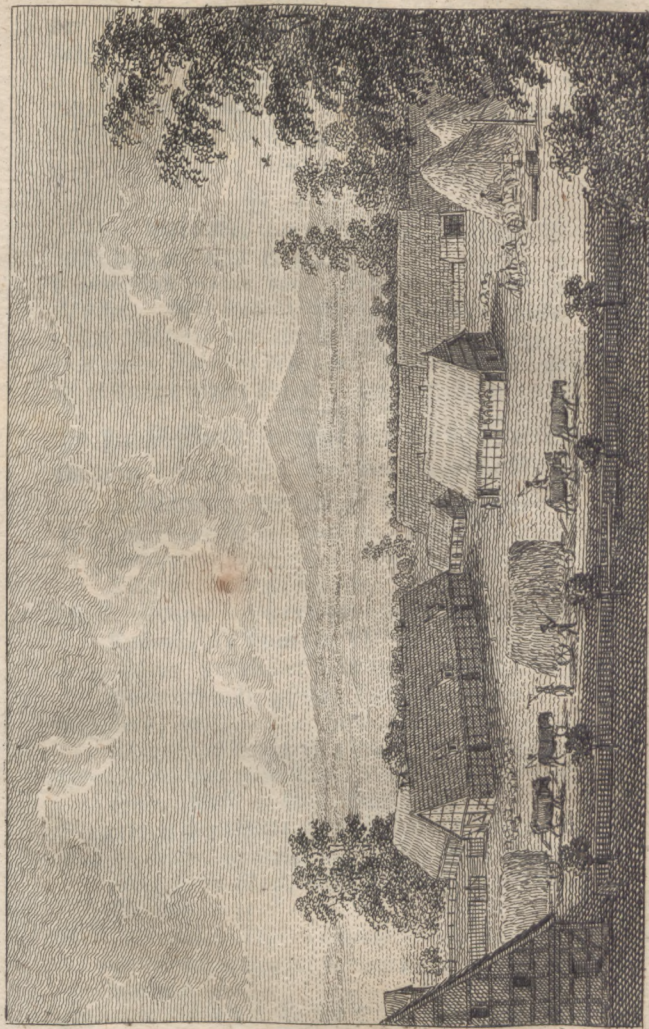
Das Herrschaft Vorwerk zu Innkau