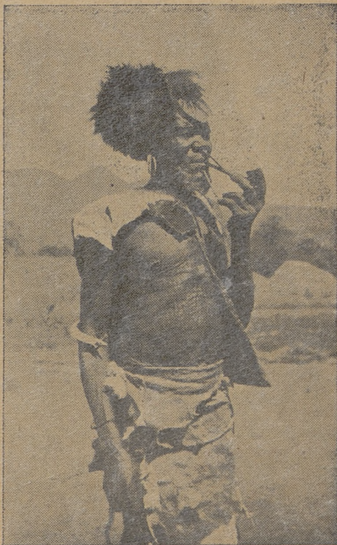
Mieszkaniec z nad jeziora Victorii

Żyją w gromadach liczących 50-100 osób. Kilka takich gromad tworzy szczep. Rodzina składa się z ojca, żony lub żon oraz dzieci.