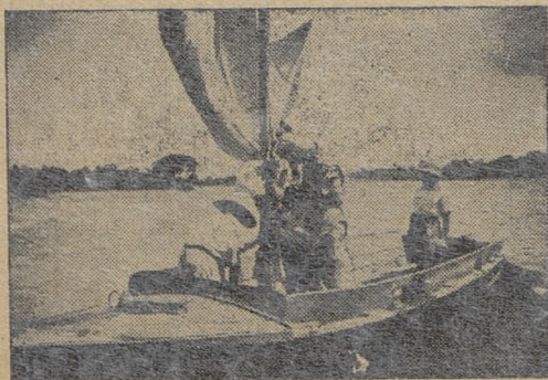
A oto nasi harcerze na ćwiczeniach żeglarskich na jeziorze Victoria