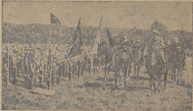
Skauci przed królem angielskim i gen. B. P. w Windsorze

Po skończeniu oblężenia wojna nie zakończyła się, lecz straciła na nateżeniu. Baden Powell otrzymał polecenie sformowania południowo-afrykańskiej milicji. W organizację jej włożył dużo pracy i energii. Byli to raczej wywiadowcy i traperzy niż policjanci w dosłownym tego słowa znaczeniu. Baden