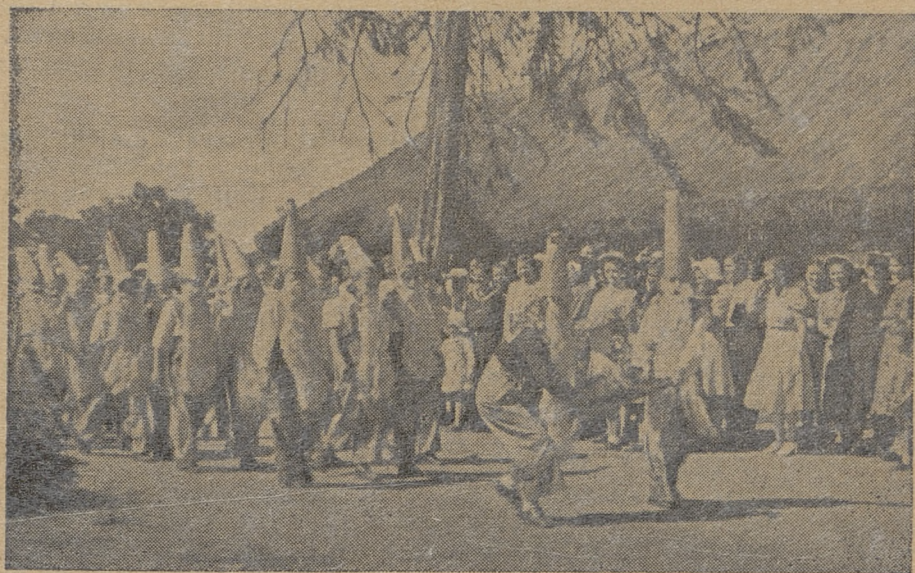
Zuchy z Kidugali w strojach krasnoludków też wzięły udział w defiladzie 3 maja 1945 r.