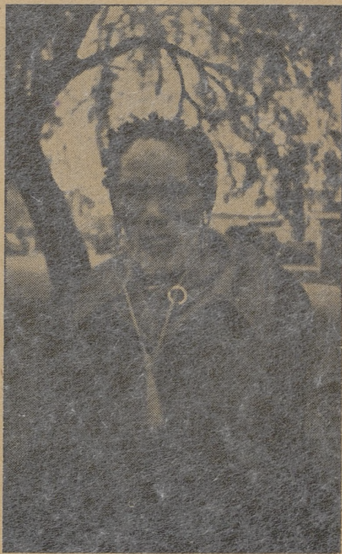
Żebraak z Nairobi

Zwyczaje ich są mieszaniną zwyczajów spotykanych u Buszmenów z domieszką przesądów, wierzeń i zabobonów, jakie posiadają okoliczni czarni mieszkańcy. Ciekawe są ich obyczaje: np. kobieta podczas porodu jest „nieczysta“ i dlatego odchodzi do buszu, tam rodzi dziecko i dopiero po tygodniu przy-