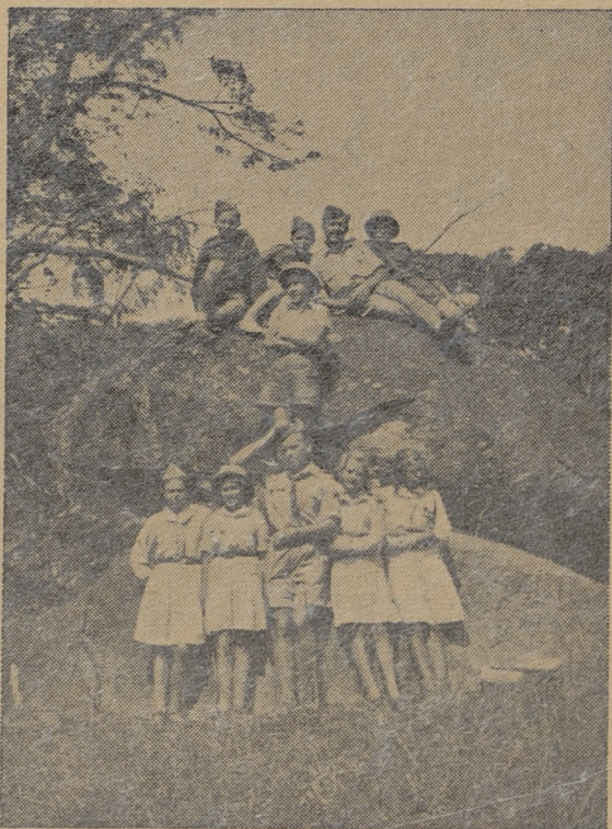
Kurs drużynowych w Marandelas

Pierwsze sprawozdanie z dnia 15. II. 1943 roku podaje ogólną cyfrę 1470 harcerek i harcerzy w 10 drużynach