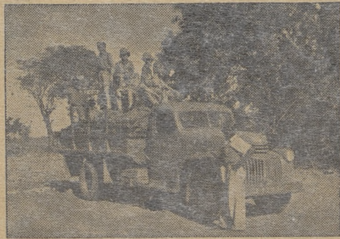
A oto już i p o b u d k a