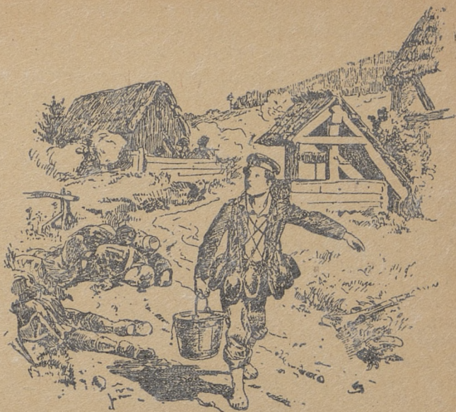
Skauci w Mafekingu