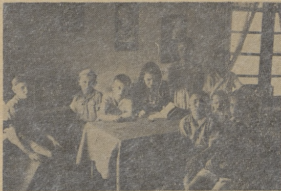
Dobrze czujemy się w świetlicy War Relief Services