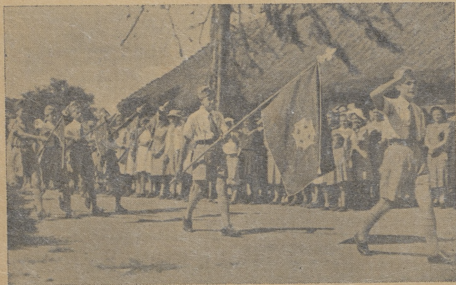
A obecnie tu polscy harcerze w Kidugali (Tanganyka) tak ładnie deflują 3 maja 1945 r.