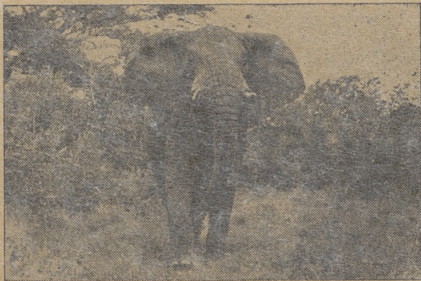
Czuje się jak u siebie w domu