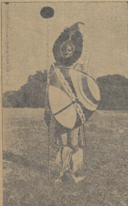
Wojownik z plemienia Masai

Na ogół jest to ładny, zgrabny i wesoły szczep lubiący tańce i zabawy. Tak jak u Buszmenów chłopcy muszą udowodnić znajomość sztuki polowania, by stać się dorosłymi mężczyznami, to u Hotentotów, jeśli chłopak nie potrafi tańczyć przez dzień i noc bez przerwy, nie zdobędzie stopnia dojrzałości.