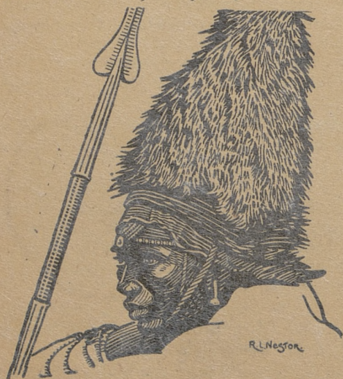
Nandi elmeran Kenya Colony

Kiedy wielki ruch migracyjny plemion Bantu zmieniał oblicze łądu afrykańskiego, Fenicjanie przybyli na północne wybrzeża afrykańskie zakładając Kartaginę i swe niezliczone faktorie. Fenicjanie lub spokrewnione z nimi szczepy posuwały się daleko w głąb Egiptu osiedlając się nawet w Abisynii, gdzie ich następcy dotychczas stanowią dominującą klasę. Nie wiadomo dokładnie, kiedy Fenicjanie zainteresowali się wschodnią Afryką — nie ulega jednak wątpliwości, iż osiedla fenickie zjawily się daleko na południu sięgając Mozambiku. Po