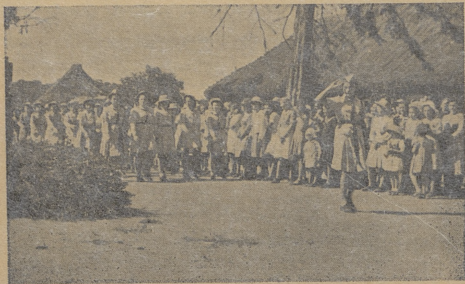
Drużyny harcerek w Kidugali (Tanganyika) sprawnie defilują 3 maja 1945 roku.