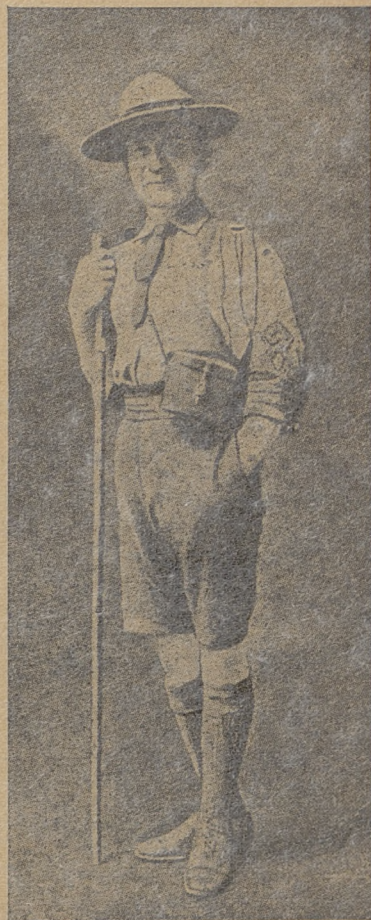
Generał Baden Powell

W roku 1887 widzimy Baden Powella w Afryce po raz drugi w ekspedycji karnej przeciwko królikowi murzyńskiemu, Dinuzulu. W czasie wyprawy, dając się unieść żyłce zwiadowczej, Baden Powell o mało nie zginął z ręki dzikiego wojownika murzyńskiego. Dzięki jednak tej służbie zwiadowczej oddaje siłom ekspedycyjnym bardzo duże usługi,