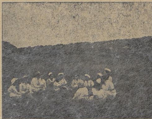
Drużyna wędrowniczek w czasie gawędy...

Następnie rozpoczęła się główna część dzisiejszej zbiórki — konkurs krasomówczy. Z okazji imienin naszych przywódców, którzy tak dzielnie i wiernie stoją na straży naszej Ojczyzny, drużynowa podała jako temat konkursu: „Za-