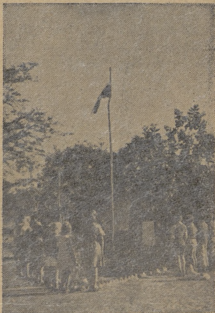
Praca na kursie drużynowych w Lusaka rozpoczyna się modlitwą