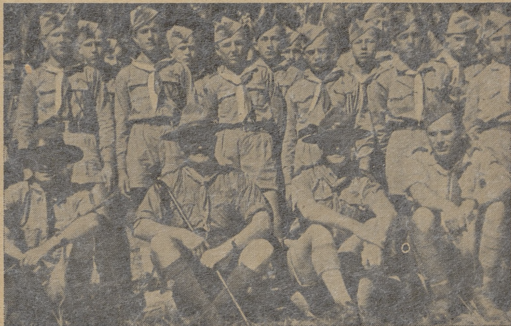
Drużyna polska na zlocie skautów w Nkana.