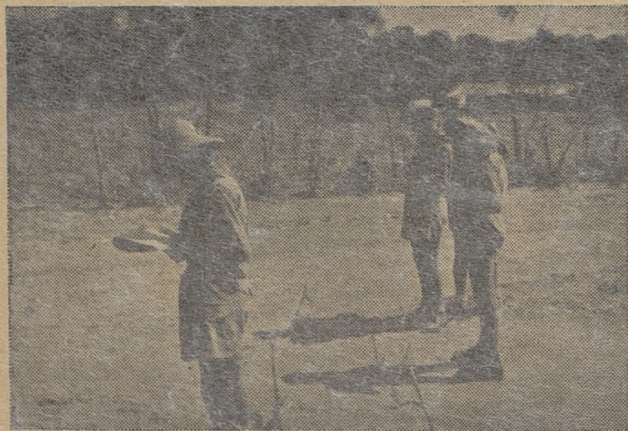
Na kursie drużynowych w Lusaka. Szkic topograficzny w marszu — to poważna praca