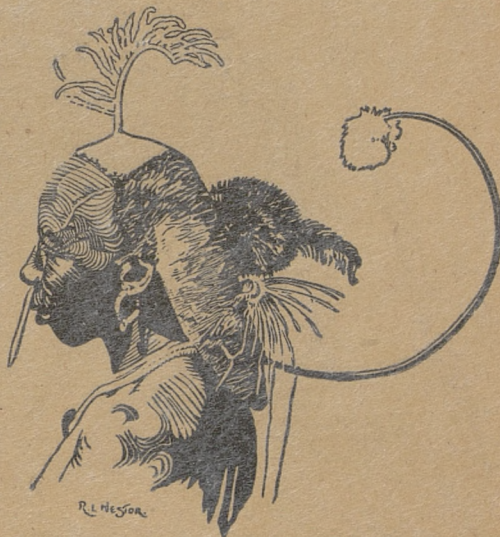
Suk native Kenya Colony

W końcu wieku XVI osiedla portugalskie były zaatakowane przez Turków. Pierwsze natarcie w roku 1585 zmusiło Portugalczyków do wycofania się z wielu miejscowości lub do zamknięcia się w murach osiedli. Przy pomocy jednak wojsk, które nadeszły z Goa, z Indii, Turków wyparto. W tym samym czasie po raz pierwszy na Oceanie Indyjskim zjawili się Anglicy i Holendrzy. W roku 1631 Portugalczycy byli wymordowani w Mombassie, którą wkrótce jednak ponownie opanowali, ale w latach 1695 i 1698, po oblężeniu trwającym trzy lata, Mombassa dostała się w ręce sułtana Muscatu. Posiadłości portugalskie rozciągające się na całe wybrzeże skurczyły się w tym czasie do niewielkiej posiadłości Mozambiku. W początkach XVII wieku Portugal-