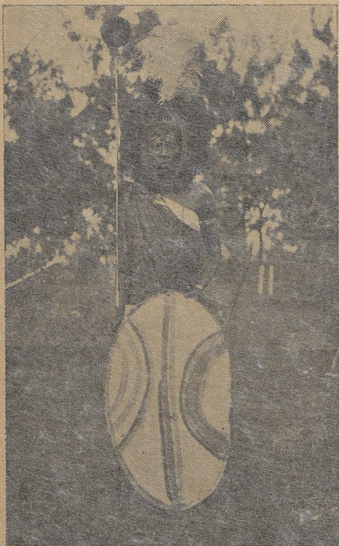
Myśliwiec z plemienia Kikuju

Jak więc widzimy, jest to szczep stojący na najniższym szczeblu kultury ludzkiej. Niemniej, przejdzie on do historii, uwieczniwszy się dzięki posiadanej sztuce ma-