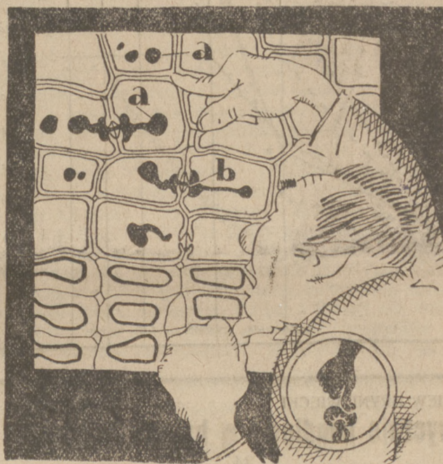
Grzybobadacz Tomcio Paluch mówi dalej:

Moi Panowie! Cieszy mnie, że preparat mój (przekrój podłużny komórek drzewnych wypełnionych grzybnia) ich zainteresował. Przyniosłem dlatego dzisiaj jeszcze podobny preparat przedstawiający przekrój poprzeczny.