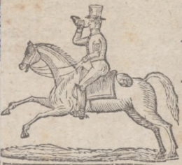
Wszystko dla wszystkich

Zamówiony będzie codzie mer 1 już d i składach.