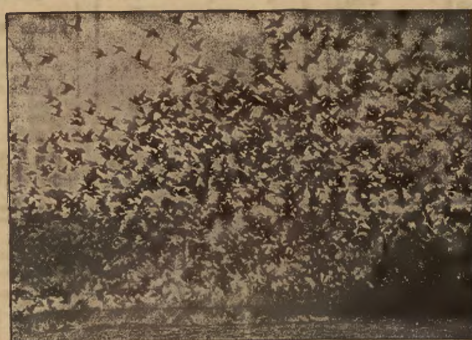
Co tu widzimy — to niezliczone stada dzikich gęsi, gnieźdzących się nad brzegami jeziora Washingtona. Teren wymarzony wprost dla poetów i... myśliwych.

Meble do wszelkich pokoi oraz oryginalne an- tyki najkorzystnie- nie nabyc można w WYTWÓRNI MEBLI Fr. Zie- lińskiego Lwów, Kollataja w podwórzu. Stale na składzie 5 848