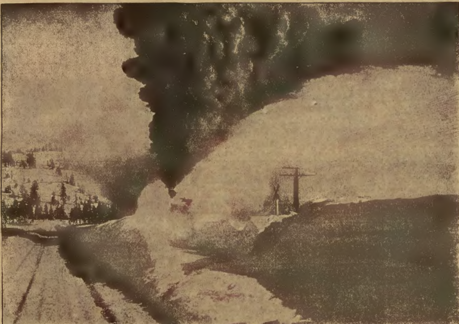
Gdy sroży się zima. Pług kolejowy pracujący nad oczyszczeniem toru kolejowego zasypanego śniegiem.

Solidny płatnik poszukuje pokoju ume- blowanego. Listy do Kurjera Lwów, Zim. 10 „Umeblowany” 10251