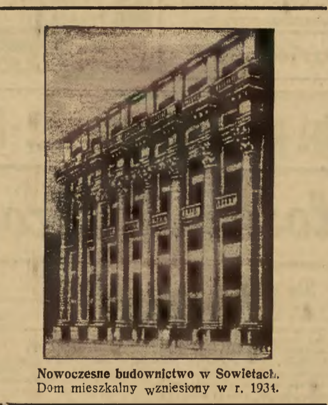
Nowoczesne budownictwo w Sowieciech. Dom mieszkalny wzniesiony w r. 1934.

Salon Gorsetów „Antinea” Piłsudskiego 11 a tal. 12-32 wyko- nuje wedle naj- nowszych modeli wiedeńskich i pa- ryskich. Gorsety, napierśniki, opa- ski poporacyjne i na czas ciąży wykonanie wykwasne. Ceny najniższe. Warunki dogodne. 174