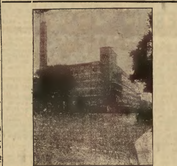
Nowoczesny dom towarowy w Rotterdamie.

Potrzebne 2 instruktorki do prowadzenia wlejskiego kursu gospodarczego. Zgłoszenia: Narodowa, Organizacja Kobiet, Lwów, Klonowicza 7 między 5 a 7 godz. 10521