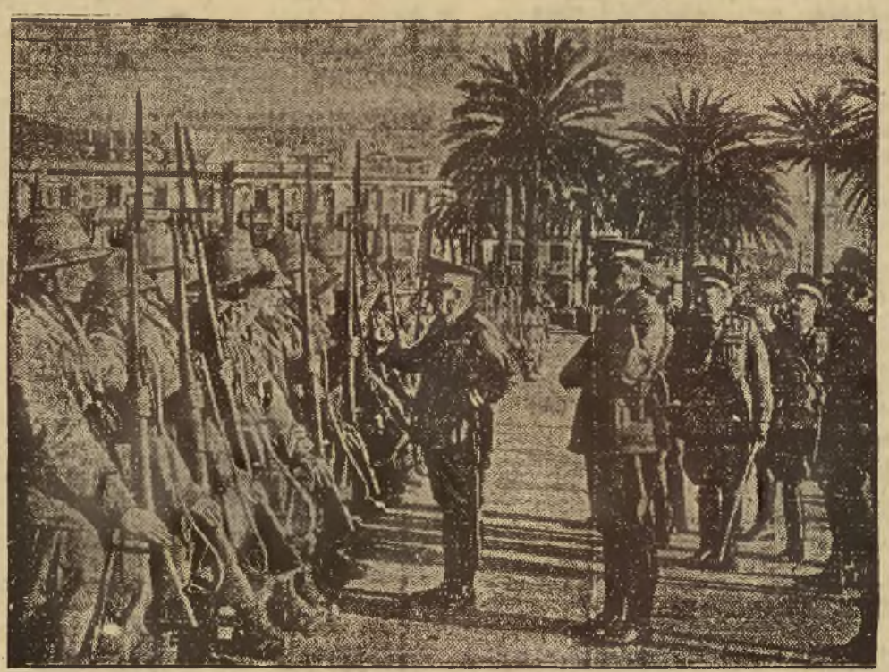
Wojenka, wojenka!... Rewja oddziałów wojsk włoskich wysłanych do Somali.

Zarządu realności poszukuje dobrze obznajomiony we wszystkich sprawach podatkowych i administracyjnych. Listy do Kurjera Lwów, Zimorowicza 10 „Obowiązkowość“. 12844