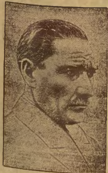
Kemal Atatürk, dyktator dzisiejszej Turcji, wybrany został ponownie przez Zgromadzenie narodowe prezydentem Republiki. Wybór nastąpił jednogłośnie.

Na charakter antagonizmu między rządem obecnym a Venizelosem rzuca światło dzisiejsza wiadomość o wstąpieniu gen. Metaxasa do rządu Tsaldarisa. Metaxas jest przywódcą monarchistów. Popierał on dotąd stale Tsaldarisa przeciw partji liberalnej, co dawało powód do domysłów, że i Tsaldaris sprzyja myśli przywrócenia monarchji. Pan Tsaldaris nie zajmował w Grecji stanowiska wyrażnego stanowiska, zadawalając się oświadczeniem, że problem ten nie jest aktualny. Ale w imieniu partji rządowej zdawano sobie sprawę, że póki Venizelos żyje, tak dłużej restauracja monarchji na drodze konstytucyjnej będzie niemożliwą. Przed kilku miesiącami dyrektor policji w Atenach zorganizował zamach na Venizelosa. Do samochodu szefa opozycji oddano przeszło dwadzieścia strzałów. Rząd czynił wszystko, by sprawcy zamachu pozostali, nieznanymi i tylko przypadek skompromitował dyrektora policji. Od tego czasu obie strony przygotowywały się do orężnego starcia. Jest możliwym, że rząd postanowił wzmocnić swą pozycję przez porozumienie z monarchistami. By uprzędzić zamach z jego strony lub ważne przesunięcia w sile zbrojnej, któreby opór republikanów uczyniły niemożliwym, marynarka i część armji chwyciły za broń.