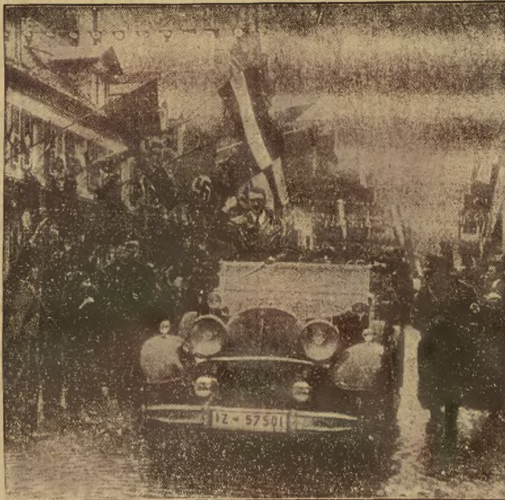
Entuzjastyczne powitanie Hitlera w mieście St. Ingbert w pobliżu Saarbrücken.