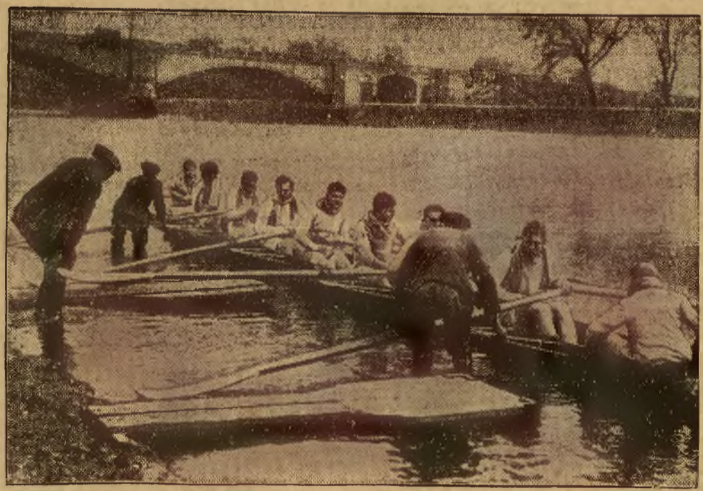
Przed dorocznymi regatami Oxford — Cambridge, które odbędą się dnia 6 kwietnia. — Załoga Cambridge podczas treningu.

3-pokojowe mieszkanie, komfort, słoneczne, wysoki parter lub pierwsze piętro w okolicy Politechniki poszukiwane, od 15 kwietnia 1935 Zgłoszenia w Administracji Lwów, Zimorowicza 10 pod „C 35”. 13103