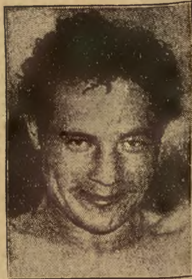
Słynny champion boks, Baer, który ma rozegrać ze Schmelingem mecz o mistrzostwo świata w boksie.