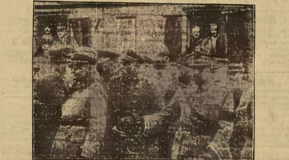
Gen. Józef Haller w otoczeniu oficerów w 1920 rku. — Moment ten uwieczniony został w narodowym filmie z dziejów Polski pt. „Sztandar Wolności”.