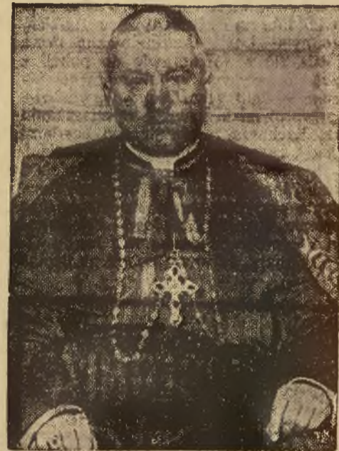
Prymas Polski, kardynał dr. August Hlond, zachorował obłożnie.