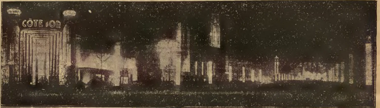
W sobotę nastąpiło uroczyste otwarcie światowej wystawy w Brukseli, w której biorą udział wszystkie niemal państwa na obu półkulach. Na zdjęciu podajemy ogólny widok wystawy w feerycznym wieczornym oświetleniu.

Wojna światowa przyniosła naturalnie tej lwowskiej instytucji wielkie, trudne do naprawienia szkody. Gdy jednak rzucimy okiem w przeszłość, gdy policzymy te trudy, tyloletnie zmaganie się i walki w celu zdobycia stanowiska na jednym z tak ważnych odcinków sztuki, to czy możemy się uchronić od refleksji, że chyba w naszej duszy powstał jakiś wielki, zasadniczy brak, który sprawia, że to, czego nam wróg nie zdołał odebrać, obecnie sami wypuszczamy dobrowolnie z ręki? — Z myślą, że Lwów obecnie opery nie posiada, nikt z jego kulturalnych mieszkańców pogodzić się nie umie. Wzdycha zatem każdy do jakiejś głowy pełnej inicjatyw do jakiejś ręki pełnej energii, i do jakiejś mocy najwyższej, zdolnej powrócić rzecz drogą, a utraconą. Słowem, tęskni, bardzo tęskni za operą!... ST. NIEWIADOMSKI.