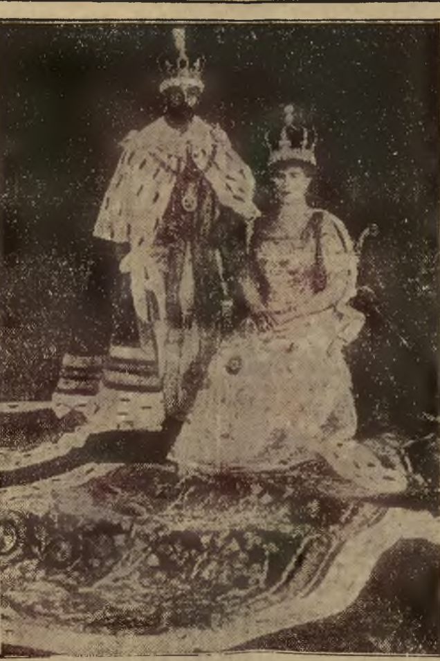
PRZED 25 LATY. — Angielska para królewska w stroju koronacyjnym po uroczystości koronowania.

Pokój z kuchnią do wynajęcia przy ul. Walka Pansieńska 73 koło boiska Pogoni. 14537