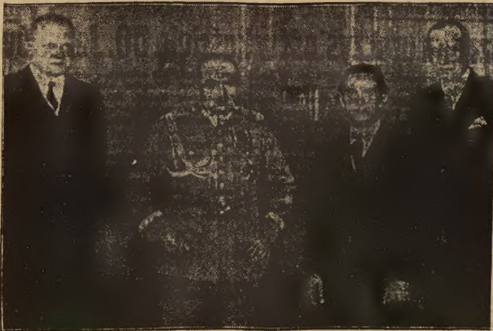
HISTORYCZNY DOKUMENT. — Na zdjęciu powyższym widzimy marsz. Piłsudskiego w towarzystwie ministra Goebbelsa.