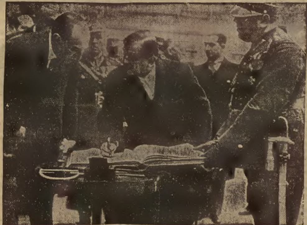
Z pobytu min. Laval'a w Warszawie. — Po złożeniu wieńca na grobie Nie- znanego Żołnierza min. Laval' wpisuje się do książki pamiątkowej. Obok min. Beck.

OGŁOSZENIA W „KURJERZE” SĄ SKUTECZNE I TANIE