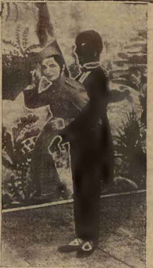
P. TADEUSZ BURKA, znakomity twórca tańców baletowych, w jednej ze swych świetnych kreacji tanecznych. (Do recenzji na str. 8-mej)

WALNE ZEBRANIE LWOW. OKREG. ZWIĄZKU NARCIARSKIEGO odbędzie się 26 bm. o godz. 19 w sali posiedzeń Tow. „Pionier” (Szajnochy 2) a w razie braku kompletu o godz. 19.30 bez względu na ilość delegatów.