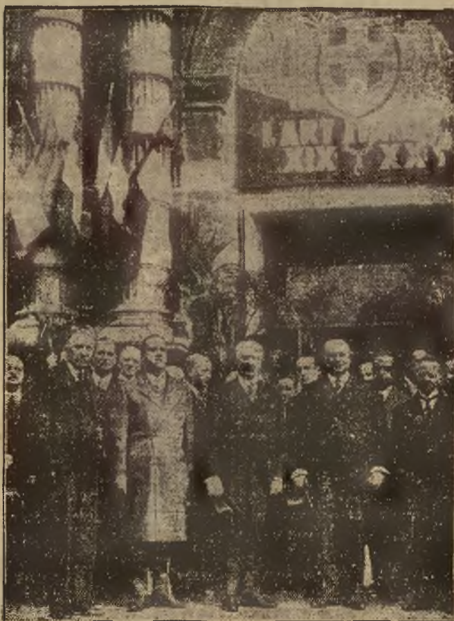
WYSTAWA SZTUKI WŁOSKIEJ W PARYŻU. — Zdjęcie z otwarcia wystawy, z udziałem prezydenta Republiki Lebrun'a.

Nie wątpimy, że i polskie sfery artystyczne zainteresują się tem wydarzeniem i ze swej strony przy urzędowaniu wystaw starać się będą usuwać wszystko to, co sztuki prawdziwej jest wyrazem zaprzeczeniem i co sztukę tę rozkłada i bolszewizuje.