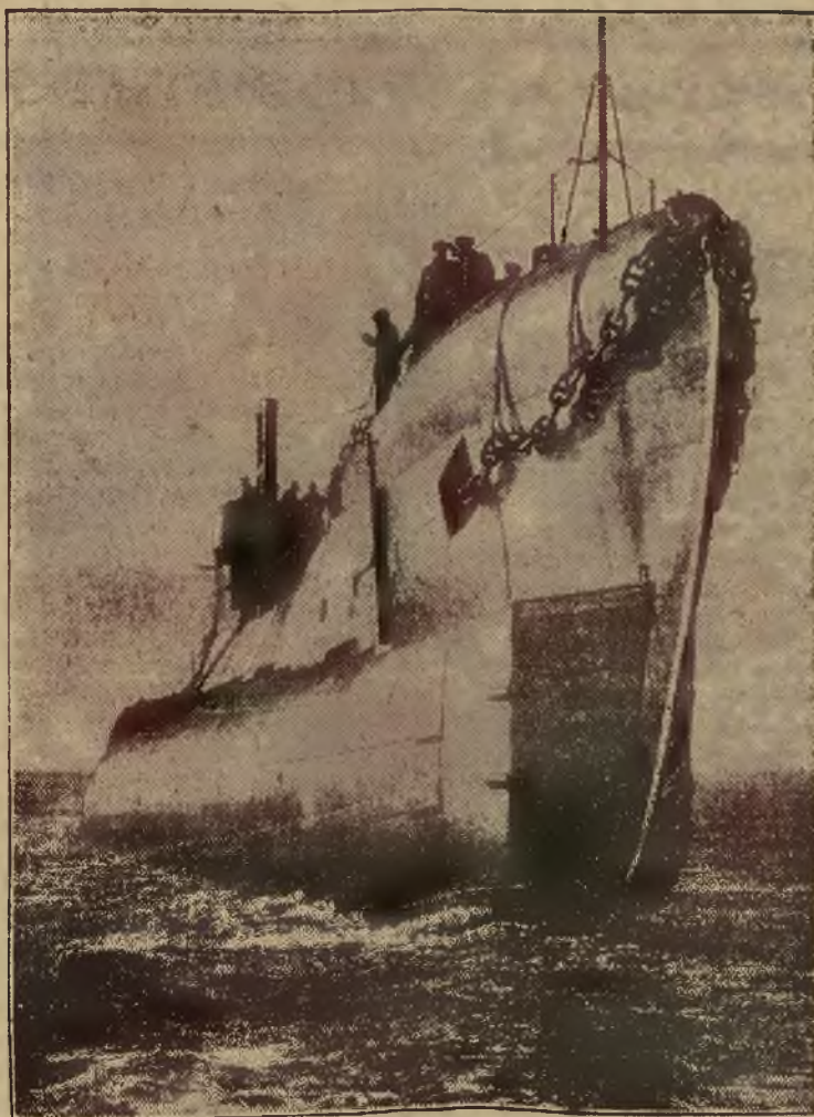
PODWODNY KOŁOS. — Angielska łódź podwodna „Severn” o pojemności 1.800 tonn. Jest to prawdziwy krążownik, stanowiący potężną broń w ewentualnej wojnie na morzu.