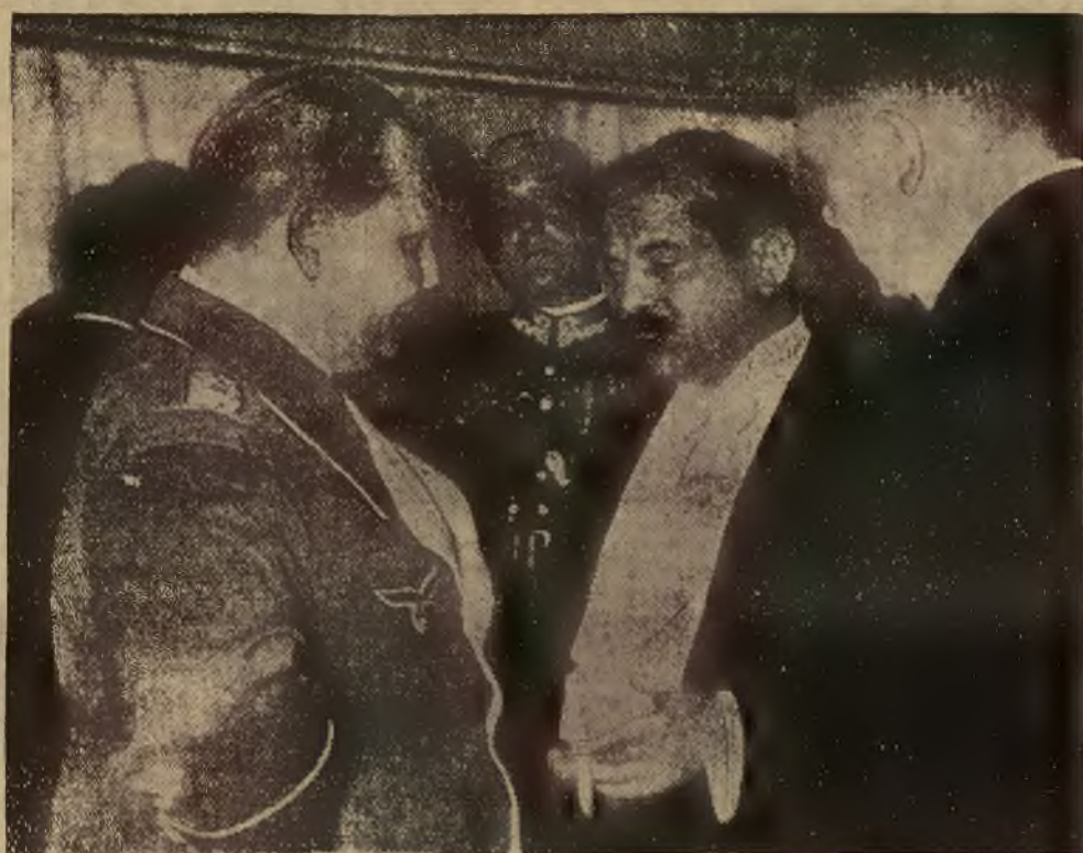
MIN. LAVAL W ROZMOWIE Z GENER. GOERINGIEM. — Jak wiadomo, po zakończeniu uroczystości pogrzebowych w Krakowie, odbył min. Laval dłuższą polityczną rozmowę z nie mieckim premierem Göringiem.

PARCELA 535 sążni za rogatką Stryjska tanio do sprzedania. Wiadomość Polczyńska 5 a m. 1. 14915