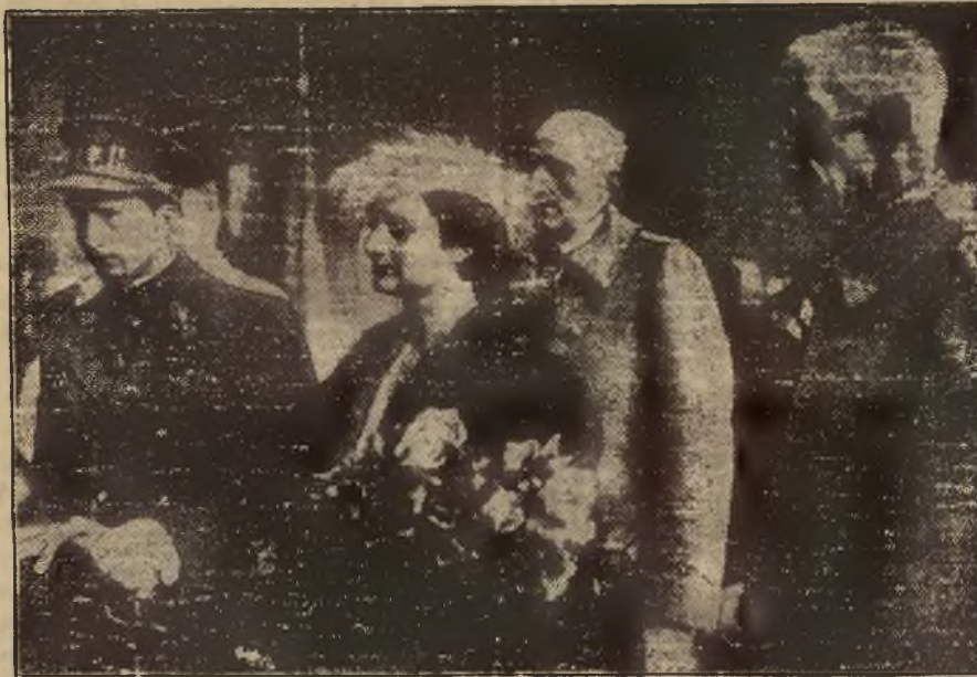
Belgijska para królewska przybyła do Sztokholmu, by wziąć udział w uroczystości zaślubin następcy tronu Fryderyka z ks. Ingrid. Z prawej strony król Gustaw szwedzki.

szerzenie parku i odpowiednie upiększenie go stawami. Wstępne pomiary już zostały przeprowadzone i roboty w pierwszych dniach bieżącego tygodnia rozpoczęte.