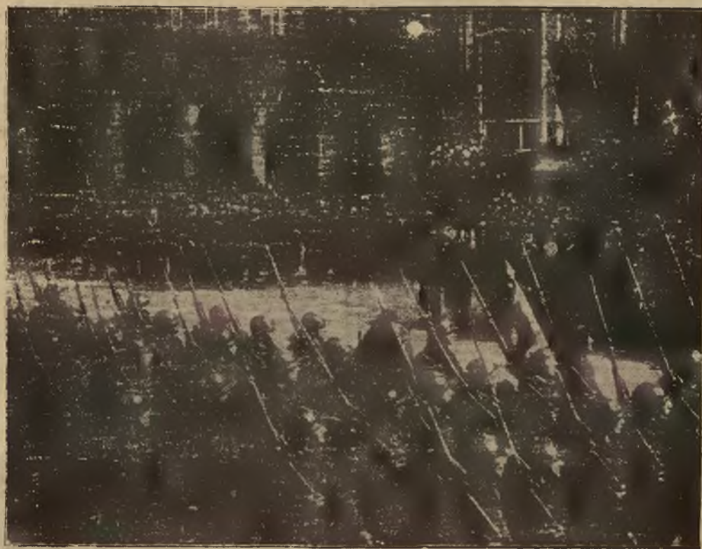
Uroczystości ku czci św. Joanny d'Arc w Paryżu. Defilada przez ponikiem świętej.

PODJĘTO ROBOTY OKOŁO RESTAURACJI KOŚCIOŁKA ŚW. WOJCIE-