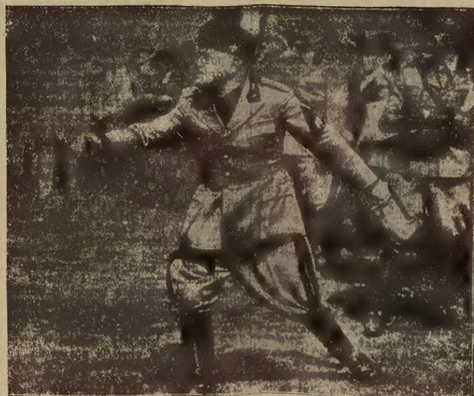
Podczas ostatnich ćwiczeń lotniczych w pobliżu Rzymu Mussolini własnoręcznie rzucał nowo skonstruowane bomby gazowe.

Intenzywnie poszukiwania czynione będą przez całe lato br., a zbierane próby będą przekazywane do analizy w laboratorjach Instytutu, który do tej na szeroką miarę zakrojonej ekspedycji, przywiązuje wielką wagę.