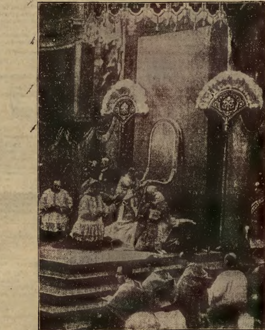
W bazylice św. Piotra odbyła się uroczysta kanonizacja dwóch angielskich męczenników: sir Tomasza Moore'a i Johna Fisher'a.

KUCHARKA poszukuje pracy do wszystkiego do małej katolickiej rodziny. — Listy do Adm. „Bardzo uczciwa“. 14997