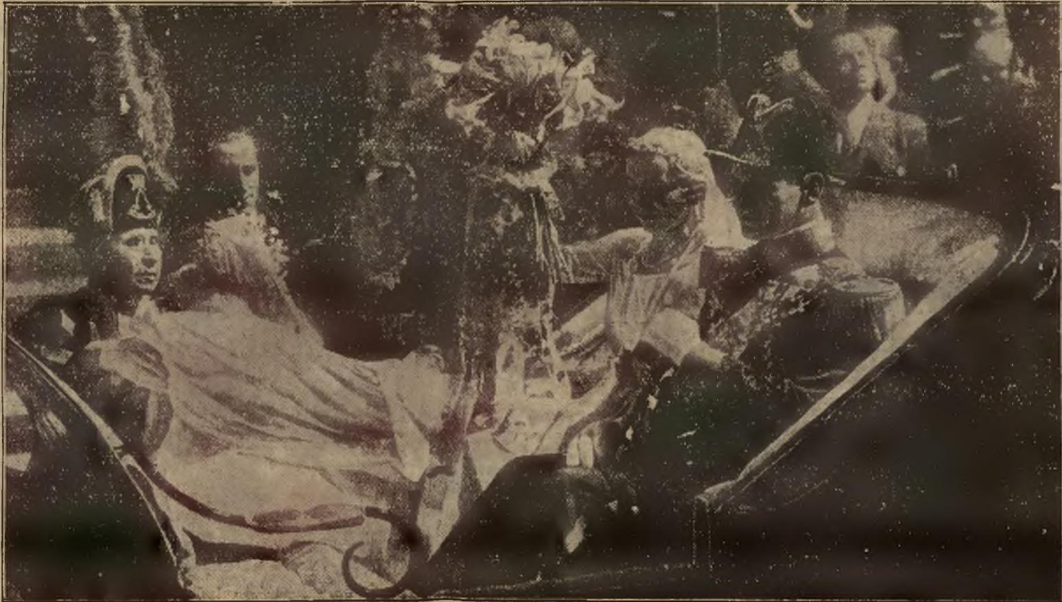
KRÓLEWSKIE GODY. W SZTOKHOLMIE. — Duński następca tronu wraz ze swą małżonką przejeżdża po ślubie przez ulice Sztokholmu.

OGŁOSZENIA W „KURJERZE” SKUTECZNE I TANIE