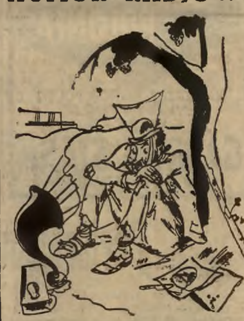
...a teraz nadajemy wiadomości giełdowe.

W WARSZAWIE mieszka się najlepiej w HOTELU CONTINENTAL ul. Marszałkowska 84 POKOJE od 4 zł. 644