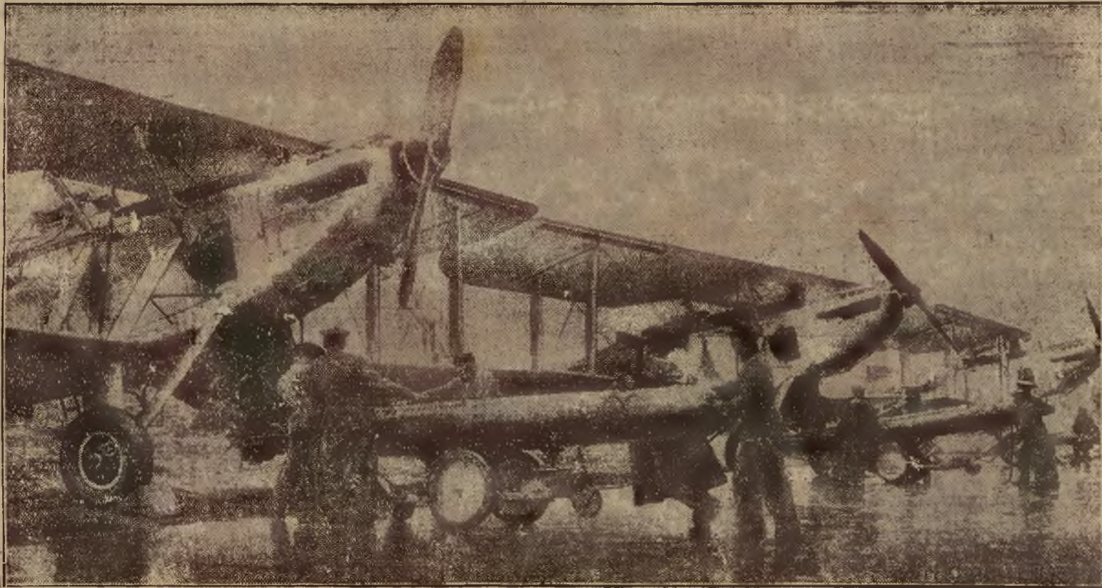
LADOWANIE TORPED NA SAMOLOT BOJOWY. Moment z manewrów angielskich na wybrzeżach Szkocji. Jedna taka torpeda waży zgorą 500 kg.

KAMIENICE, wille, domy parterowe komfor- towe nowomurwane oraz przed wojenne, parcele budowlane w każdej dzielnicy miasta najta- niej można kupić przez Biuro „Kontrakt”. Batorego cztery. In- formacje bezpłatne. 17053