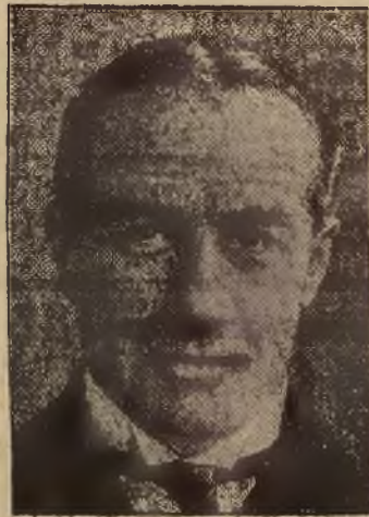
Nowy premier angielski Stanley Baldwin.

Mianowanie Baldwina przyjęła opinia angielska z wielkiem zadowoleniem cieszy się on bowiem dużą popularnością i autorytetem i uchodzi za wzór wytrawnego, zrównoważonego polityka (R.).