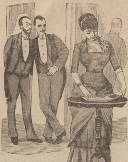
Immer nicht glücklich.

Gast: „Da ist sie; im Ballsaal hat sie Dich nicht getroffen, jetzt sucht sie hier im Album Dein Bild.“