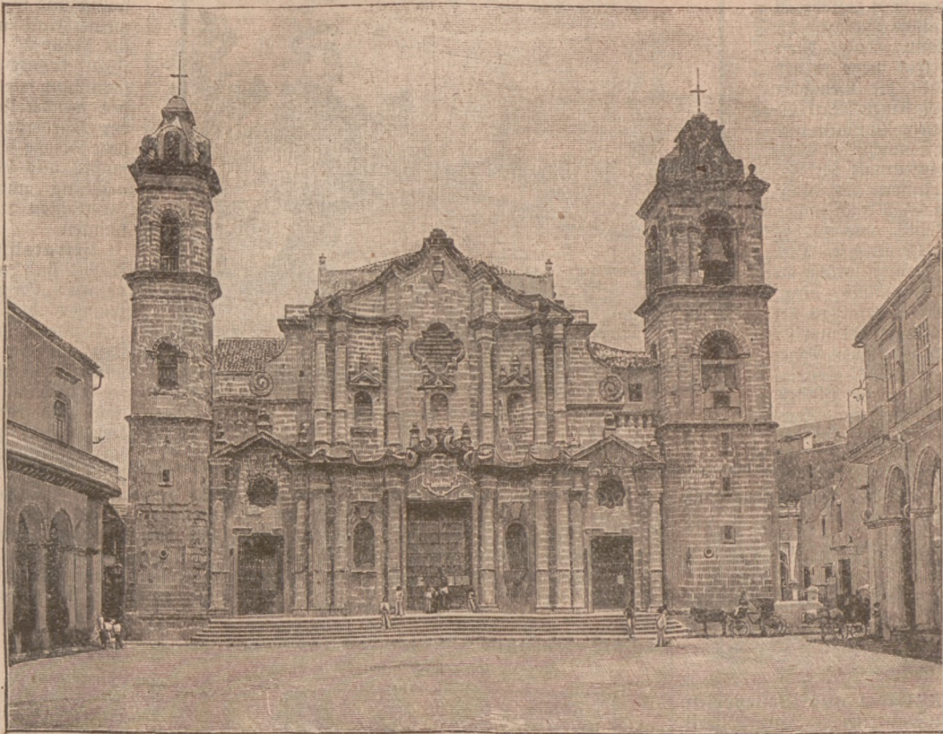
Die Kathedrale in Havanna.

ganz seltsame, rötliche Färbung an, als ob sie nahes, drohendes Unheil verkünde. Eine feine Staubwolke überzieht die Ebene, einige heftige Windstöße, gleich prüfenden Vorboten einer dunklen, furchterlichen Naturmacht, brausen daher und berauben uns den Atem. Der Himmel hat in wenigen Minuten seine Farbe geändert, er sieht ganz schwarzgrau aus und ein unheimliches Dunkel hüllt die Gegend ein. Wir haben kaum Zeit, uns zu wenden, auf den Boden zu werfen und den Kopf in den Sand zu graben, so jagt auch schon ein heulender, säuselnder Wirbelwind über die Ebene, ungeheure Sandberge aufwühlend, alles, was ihn in seinem rasenden, todbringenden Lauf aufhalten will, unbarmherzig vernichtend.