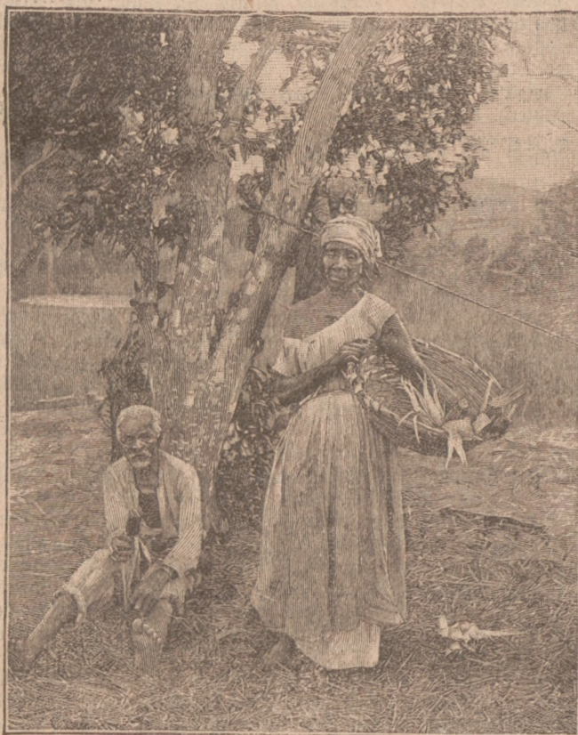
Rast bei der Tabaksernte.

„Man soll den Teufel nicht an die Wand malen, und das weiße Kamel ist schlimmer wie der Teufel. Auch die Araber fürchten es. Meist erscheint es in mondheiler Nacht. Gespensterhaft kommt es über die Ebene und schreitet drohend langsam auf den Posten zu, dessen Glieder vor Schreck gelähmt sind; er kann keinen Laut hervorbringen, ist selbst nicht mehr im Stande, sein Gewehr abzurücken, um die Kameraden zu benachrichtigen. Wie von Geistermacht an den Platz gebannt, ist er unrettbar verloren. Das weiße Kamel rührt niemand an, sein Blick tötet. Die Ablösung kommt und findet den Soldaten tot am Plage